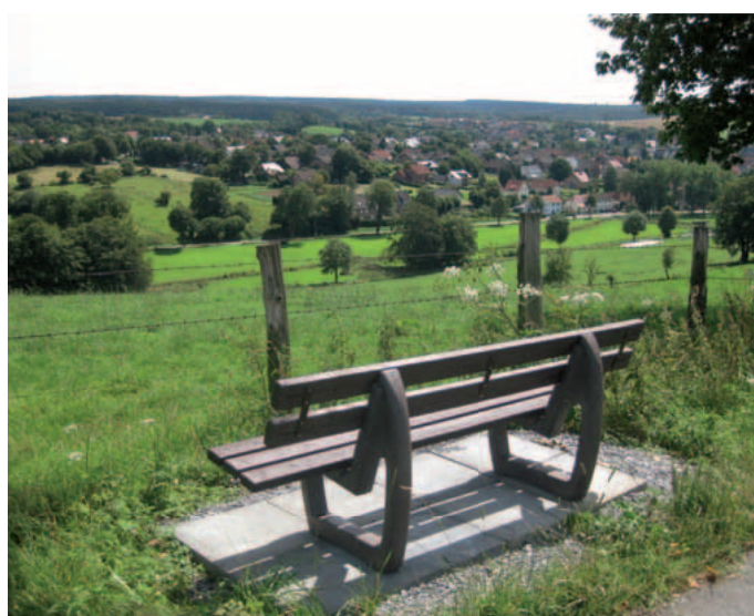
Blick auf Schwaney