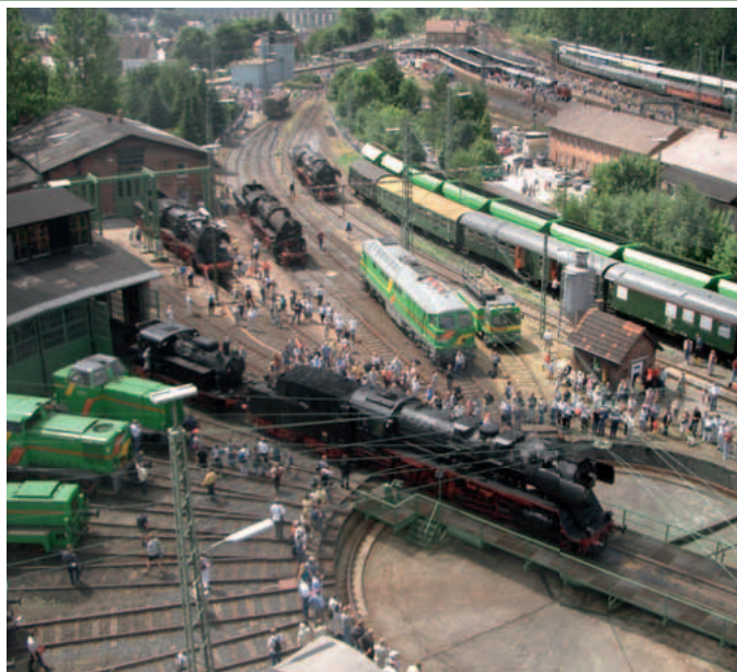
Vivat Viadukt in Altenbeken