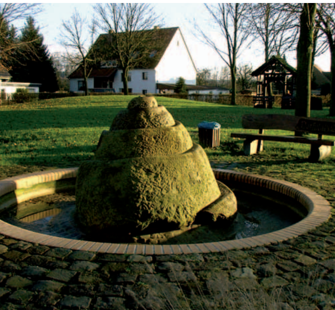
Dorfplatz in Buke