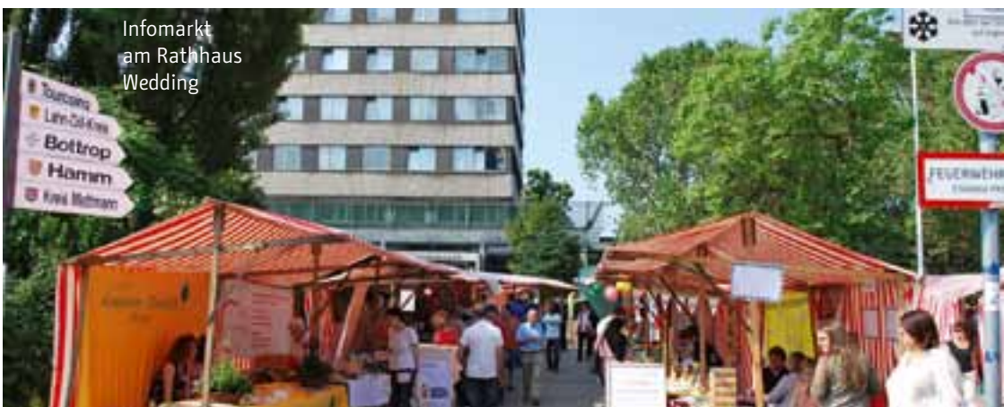
Infomarkt am Rathaus Wedding