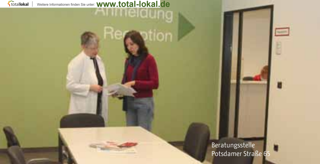
Beratungsstelle Potsdamer Straße 65