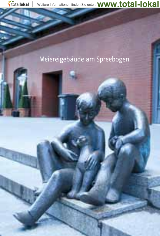
Meiereigebäude am Spreebogen