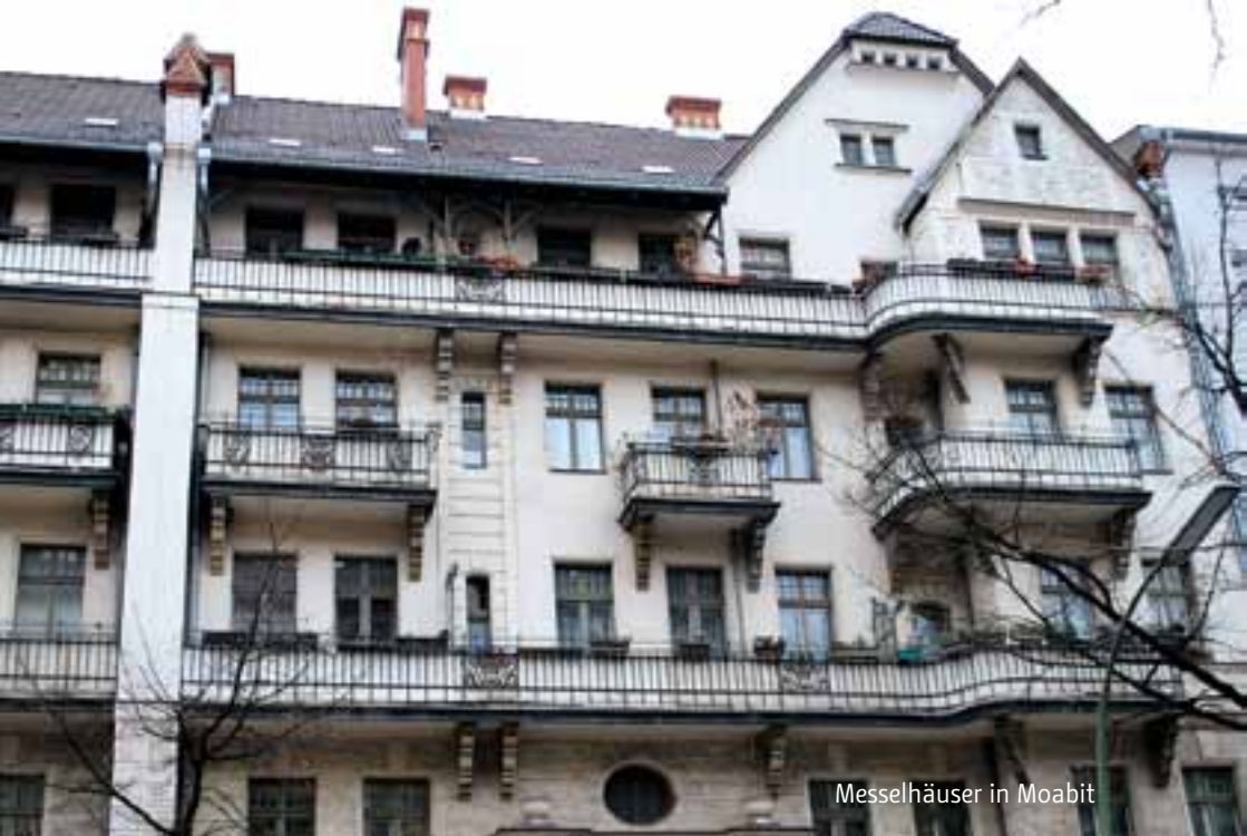
Messelhäuser in Moabit