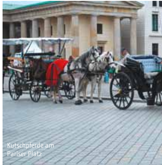
Kutschpferde am Pariser Platz