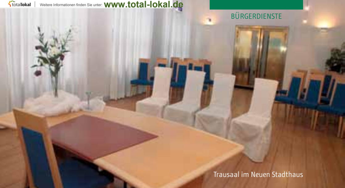
Trausaal im Neuen Stadthaus