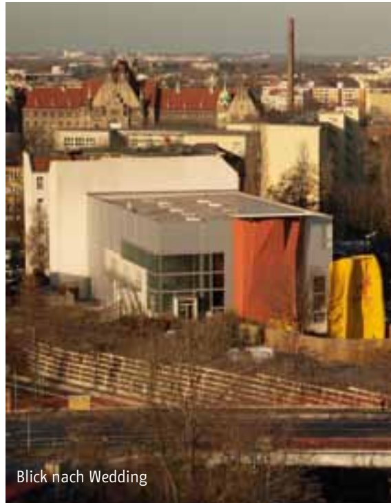
Blick nach Wedding

Er berechtigt zur Anmietung einer Wohnung im sozialen Wohnungsbau oder einer belegungsgebundenen Wohnung in den östlichen Bezirken.