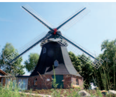
Alte Mühle Dibbersen