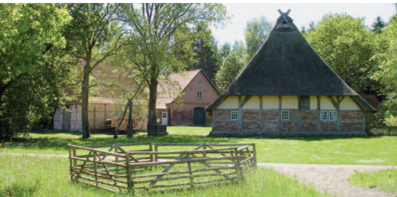
Museumsdorf in Seppensen

Liebhabern von historischen Ausstellungen und Lesungen seien zwei Adressen empfohlen: Das Museumsdorf in Seppensen und der Kulturbahnhof in Holm-Seppensen 6. Auch die Holmer Mühle 1, eines der ältesten Bauwerke der Stadt, gilt als Tipp für die Freunde von Vorträgen und Konzerten. Im Ortsteil Dibbersen und Sprötze gelten die Dibberser Mühle 3 sowie das Heimatmuseum Vierdörfer Dönz 12 als Kulturzentren.