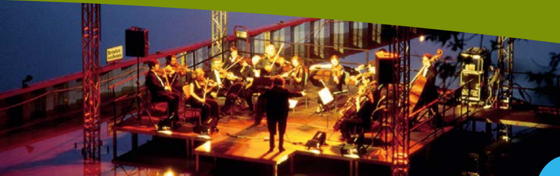
Klassik auf dem Vulkan