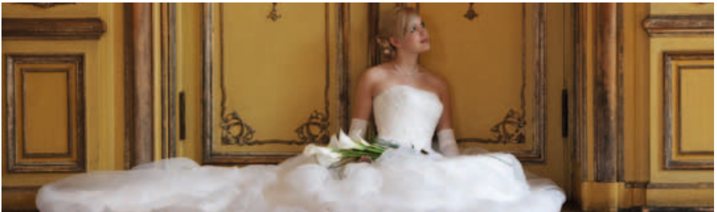
Style Hair factory

Auf unserer Internet-Seite – www.doebelner-dance-company.de – können Sie sich einen ersten Eindruck von uns machen. Für detaillierte Absprachen stehen wir Ihnen gern zur Verfügung – Telefon: 0177 / 730 30 80.