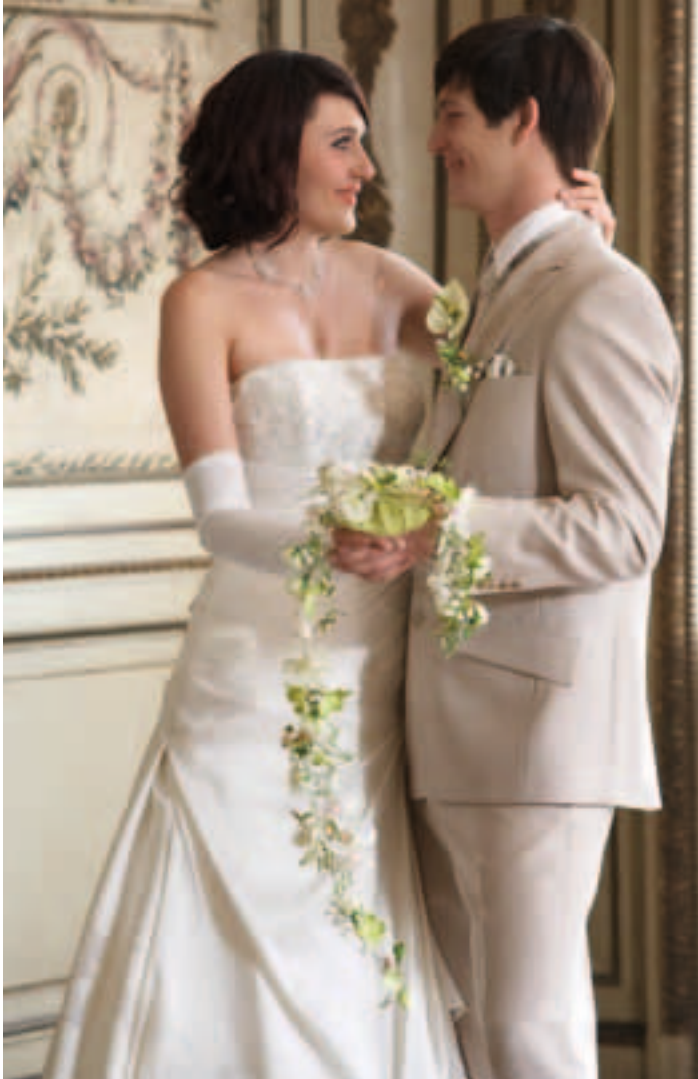
Style Hair factory