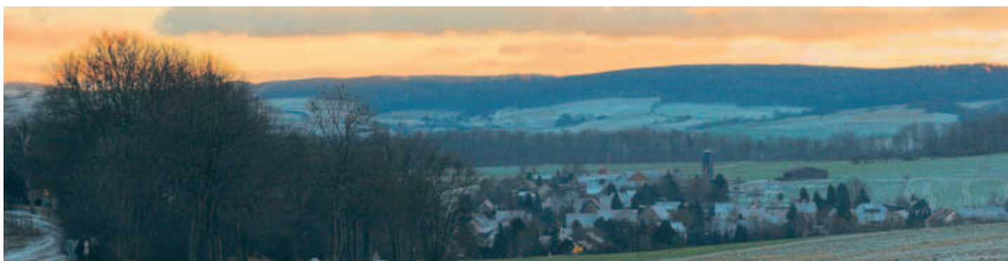
Sonnenuntergang über dem Ith, vom Duinger Berg über Weenzen