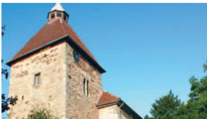
Katharinenkirche in Duingen