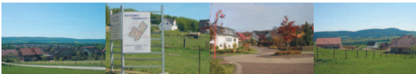
Neubaugebiet mit Blick zum Ith