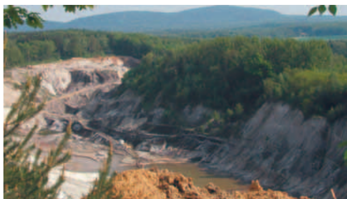
Sandgrube Weenzer Bruch

Es werden z. B. verschiedenste Kulturveranstaltungen angeboten und in Weenzen gibt es (für die Region doch ungewöhnlich) eine niedersächsi-sche Karnevalshochburg! Einigen Einzelhandelsbetrieben ist es erfolgreich gelungen, den Strukturwandel in den 70er Jahren zu bewältigen. So wird der Einzelhandel dominiert von einem regional bekannten Haushalts-, Spiel-waren- und Gartenbedarfsunternehmen. Auf dem ehemaligen Duinger Bahn-gelände wurde eine neue Ortsmitte geschaffen, die den Kern des Ortes völlig neu erscheinen lässt. Ab 2009 völlig neu gestaltet, findet sich dort der Seniorenwohnpark aus einem Wohnheim, einem Gebäude mit 24 betreu-ten Wohnungen und einem Park bestehend. Der großzügige Marktplatz, der allerlei Angebote, wie einen Wochenmarkt, diverse Veranstaltungen ermöglicht und eine integrierte Boulefläche vorweist, hat aus einer Brachfläche einen Blickfang werden lassen.