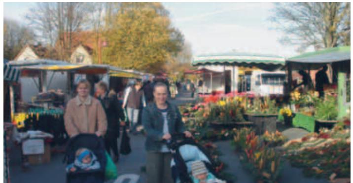
Donnerstags ist Markttag