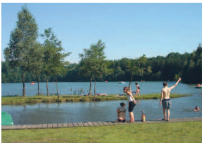
Ein Sommertag am See