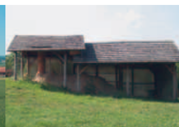
Coppengrave, Historischer Ofen