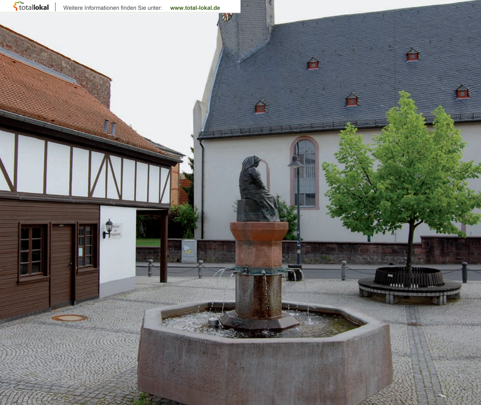
Museum zur Ortsgeschichte (links)