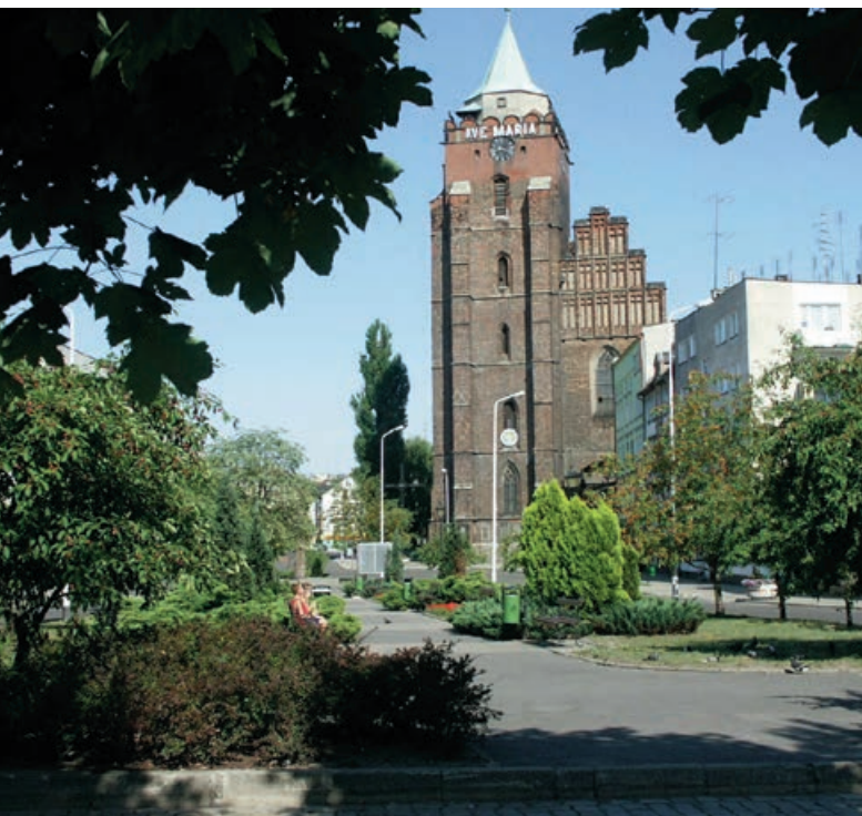
Marktplatz in Chojnów

Der Hl. Ludwig machte hier auf dem Weg in die Heilige Stadt Halt. Die Pilger aus Saint Jacques de Compostela hielten hier an und zahlreiche Konvente entstanden im 17. Jahrhundert (Mini-mer, Kapuziner, Ursuliner, Visitandiner).