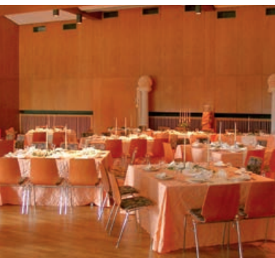
Saal des Bürgerhauses

Nähere Informationen erhalten Sie im Rathaus unter der Telefonnummer 405-121 .