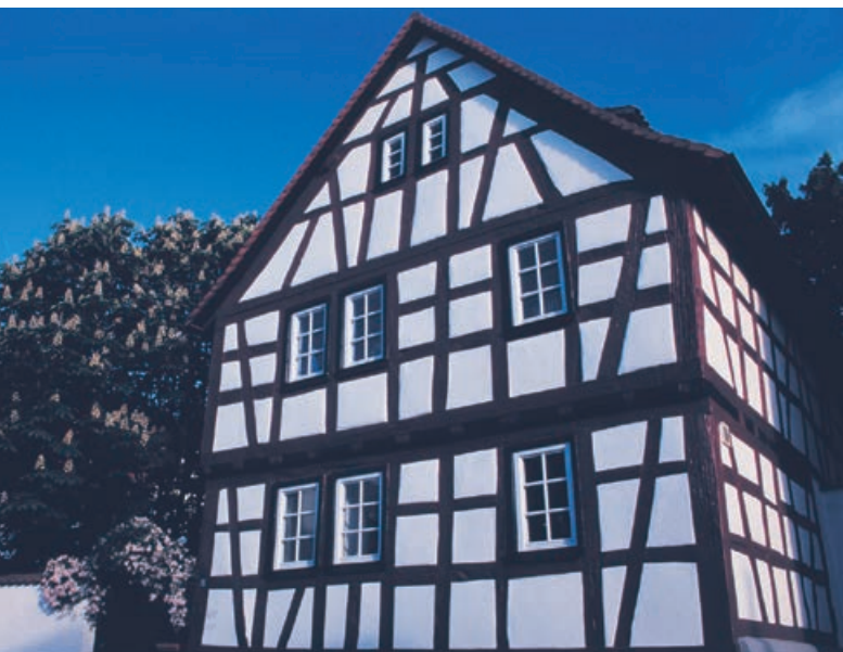
Haus in der Schulstraße

Die jetzige Kirche hat ihren Ursprung in einer Ost-West-Kapelle, die zu Beginn des 14. Jahrhunderts mit einem gotischen Anbau versehen wurde. 1614 wurde diese Kapelle abgerissen, und es entstand eine geräumige Predigtkirche, die nunmehr im Gegensatz zu der abgerissenen Kapelle in Nord-Süd-Richtung angeordnet war. Haupteingang ist jetzt an der Nordseite.