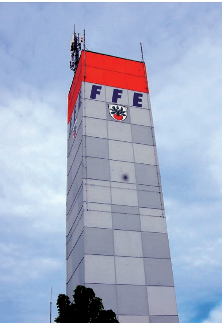
Freiwillige Feuerwehr Egelsbach