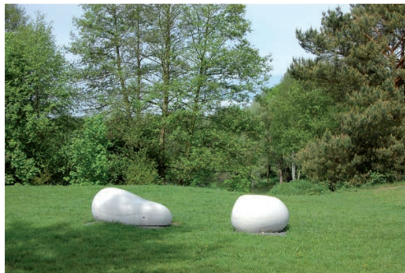
Freizeitgelände an der Waldhütte