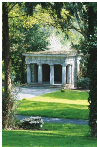
Schloss Merten, Pavillon

Freunde der Tier- und Pflanzenwelt, aber vor allem Kinder und Jugendliche sollten es nicht versäumen, den Lehrpfad über Imkerei und Waldwirtschaft in einem der schönsten Waldgebiete der Region zu besuchen.