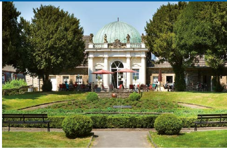
Orangerie Schloss Merten