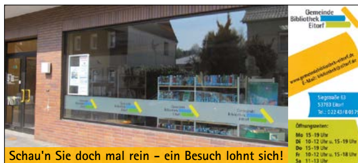
Schau'n Sie doch mal rein – ein Besuch lohnt sich!