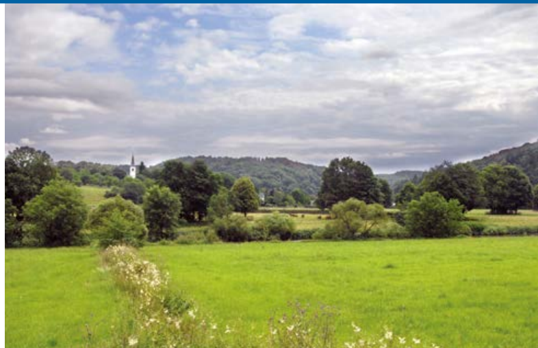
Blick auf Merten

579 Schladern Bf · Dreisel · Herchen Bf · Eitorf Bf · Hennef Bf