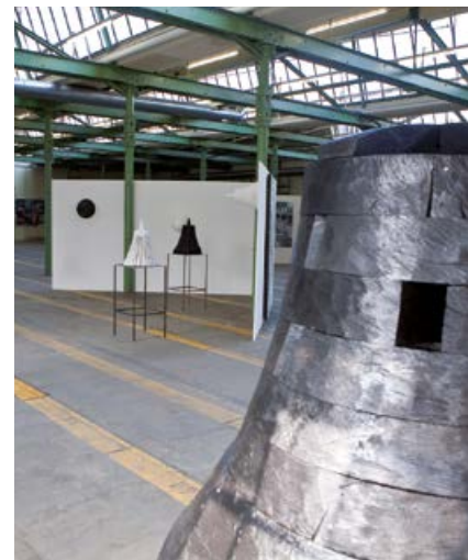
... Kunst in der Werkshalle