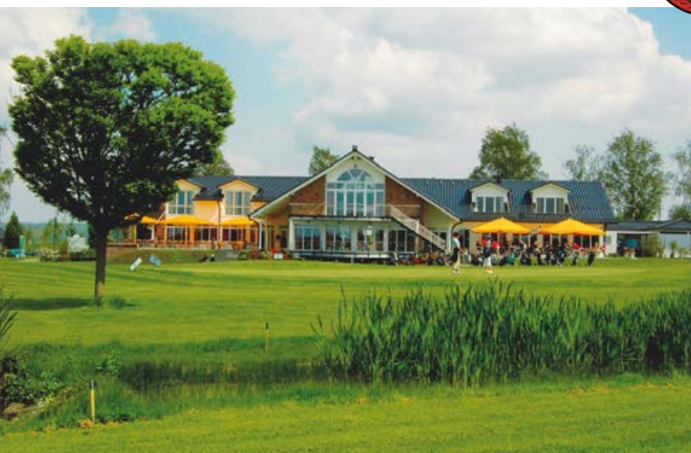
Golfclub Gut Heckenhof

Nachdem die Kirche im Jahr 1889 abgebrochen wurde, stand der Turm als Wahrzeichen Eitorf's, bis er am 17. März 1945 einem Bombenangriff zum Opfer fiel.