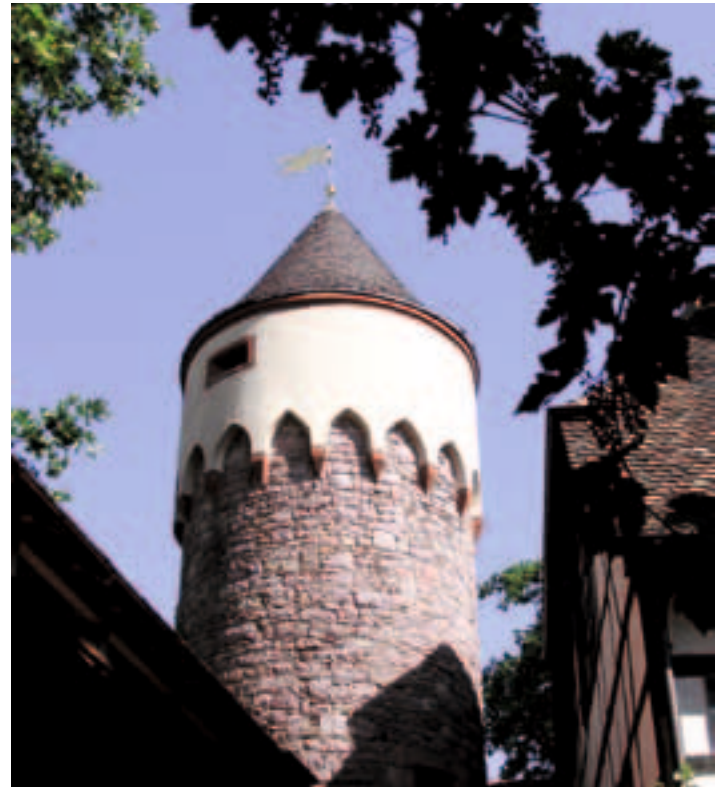
Der Lauer Turm