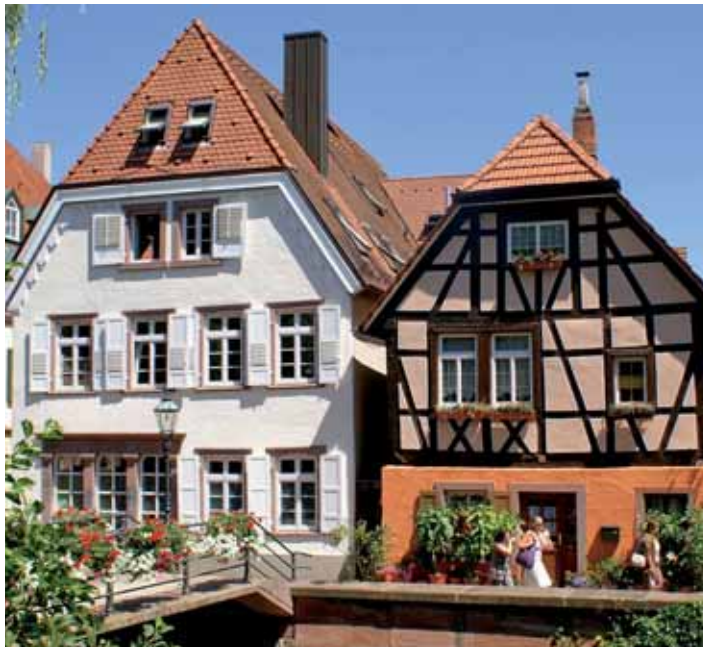
Häuser an der Alb