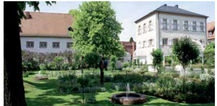
Rosengarten im Schlossbereich