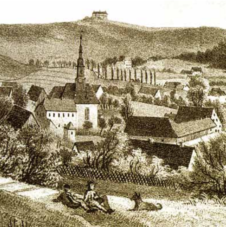
Historische Ansicht Flöhas aus dem Jahr 1480 mit Blick auf die Georgenkirche.

Die urkundliche Ersterwähnung Flöhas geht zurück in das Jahr 1399, in dem die Stadt mit „zcu der flaw“ bezeichnet wird. Grabungen im Jahr 2006 im Chor der spätgotischen Georgenkirche brachten allerdings spätromanische Fundamente ans Licht, die auf eine Kirche aus der Zeit von 1150 bis 1250 hinweisen. Damit ist eine Besiedelung Flöhas bereits nach 1150 nachweisbar. Flöha, Gückelsberg und Plaua wurden als einreihige Waldhufendörfer angelegt, was auf eine rheinfränkische Besiedelung hinweist.