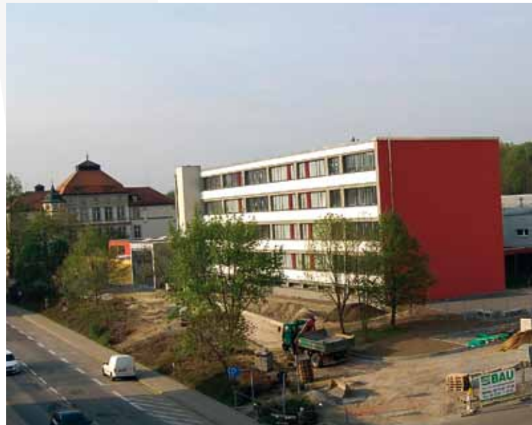
Der Komplex der Mittelschule Flöha-Plaua während der Neubau- und Sanierungsphase im Frühjahr 2011