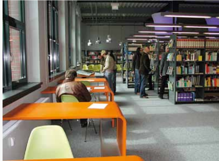
Die Stadtbibliothek Flöha ist eine der modernsten Bibliotheken im Kulturraum Mittelsachsen.

Das Angebot umfasst die Entleiherung von Büchern, Zeitschriften, CDs, Spielen und Kassetten, Literatur für Aus- und Weiterbildung, für Umschulungen sowie für Freizeit und Hobby. Es können Bibliothekseinführungen für Kinder und Jugendliche, Schriftstellerlesungen, Veranstaltungen und Programme für Projektstage vereinbart werden.