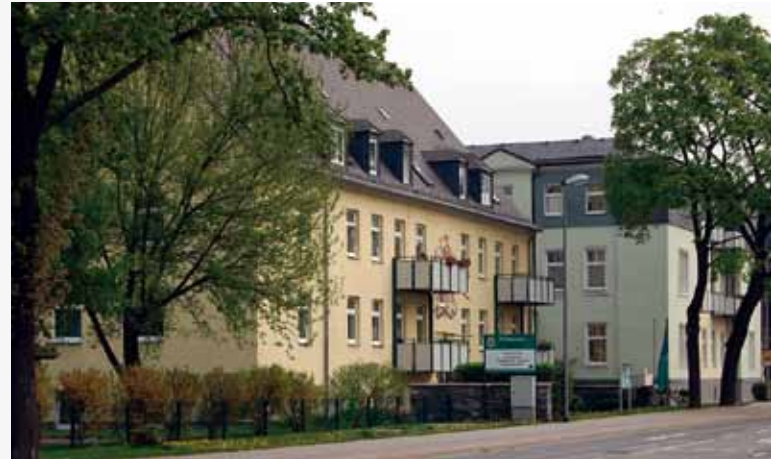
Die Wohnanlage für betreutes Wohnen der Volkssolidarität an der Augustusburger Straße.

Nähere Informationen finden Sie auf der Website der Stadt Flöha www.floeha.de unter „Bürgerdienste“ – „Gesundheit, Soziales“.