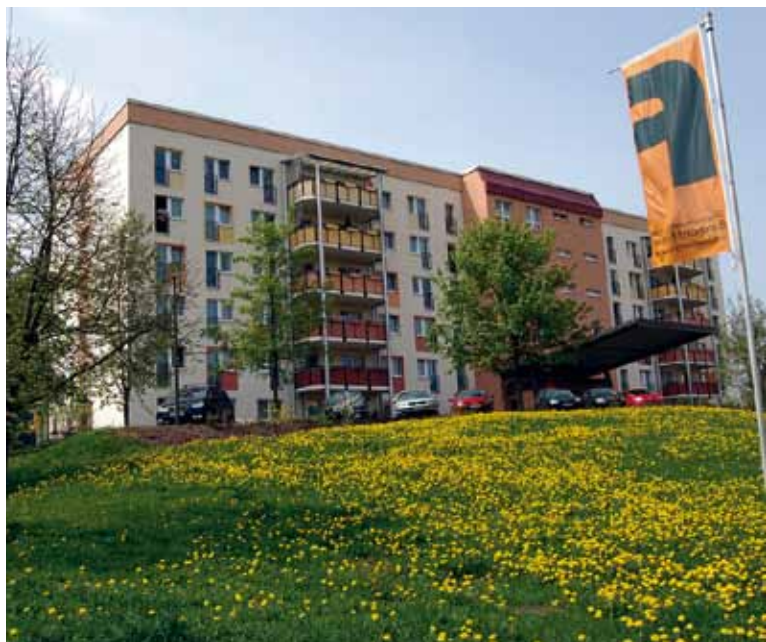
Für 128 Bewohner bietet das Seniorenpflegeheim „Fritzenhof“ ein neues Zuhause