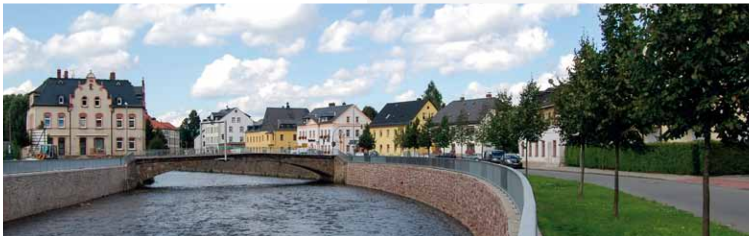
Ansicht von Flöha

Kein Zugang für elektronisch signierte sowie für verschlüsselte elektronische Dokumente.