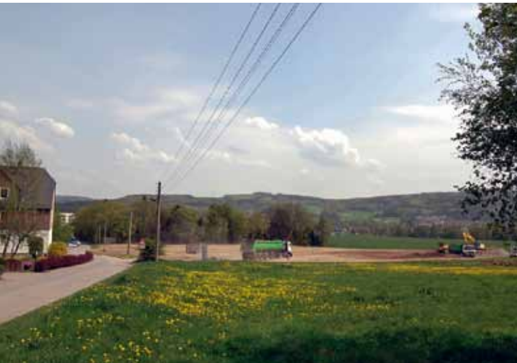
Das noch unerschlossene Wohnungsbaugelände an der Waldstraße. Hier sollen in den nächsten Monaten Eigenheime in einer besonders reizvollen Lage entstehen.

Der Traum von den eigenen vier Wänden ist für viele junge Familien auch in Flöha wahr geworden. Auch wenn in den letzten Jahren Bauland nicht mehr in größerem Umfang zur Verfügung steht, so versucht die Stadtverwaltung auch kleinere Standorte in reizvoller Lage auszuweisen.