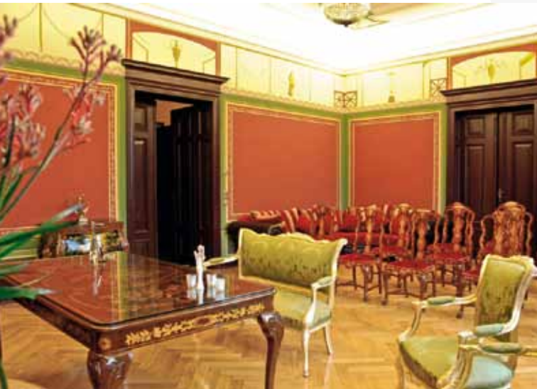
Das besondere Ambiente der Villa Gückelsberg verspricht ein besonderes Hochzeiterlebnis

Sie möchten in Kürze heiraten und eine Familie gründen? Dann wartet auf Sie nun ein völlig neuer Lebensabschnitt, der viele spannende Aufgaben und Herausforderungen mit sich bringt. Auch wenn es um das Thema Heiraten geht, hat Flöha etwas Besonderes zu bieten. Zwei stilvolle Trauzimmer in der Großen Kreisstadt machen Ihren großen Tag für Sie und Ihre Gäste zu einem unvergesslichen Erlebnis.