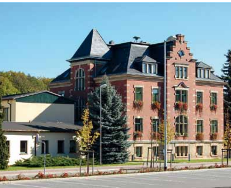
Das Gebäude der Stadtverwaltung Flöha an der Augustusburger Straße.