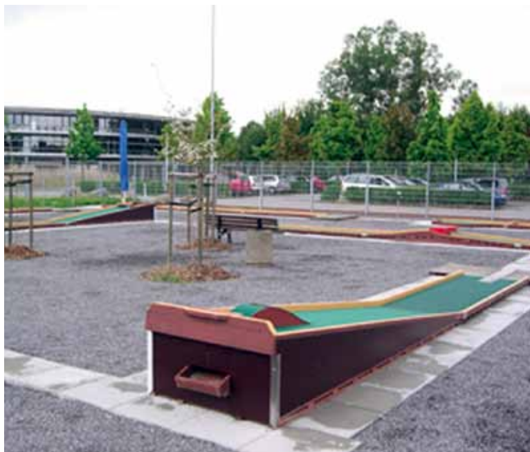
Auf der Minigolfanlage des Fördervereins für Nachwuchssport e.V. werden auch Deutsche Meisterschaften ausgetragen.