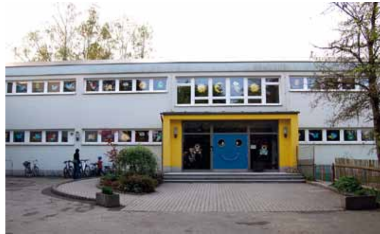
Die städtische Kindertagesstätte „Spielhaus Groß und Klein“