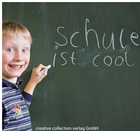
creative collection verlag GmbH

Füller, die sowohl für Rechtshänder als auch für Linkshänder geeignet sind. Daneben bietet der Fachhandel spezielle Linkshänder-Schulartikel an. Diese machen nicht nur das Leben und Lernen leichter, sie unterstützen auch den natürlichen Bewegungsablauf der Linkshänder. So haben z. B. Collegeblöcke mit Kopfschnecke den Vorteil, dass die Kinder nicht mehr durch die links angebrachte Schnecke beim Schreiben behindert werden. Spitzer verfügen über Messer in anderer Drehrichtung und bei Scheren sind die Klingen genau anders herum angebracht. Auch die übrige Lernumgebung sollte dem Linkshänder angepasst sein: So empfiehlt sich, dass Linkshänder in der Schule links außen oder neben einem anderen Linkshänder sitzen, damit sich die Nachbarn nicht mit den hantierenden Armen in die Quere kommen. Und die Computermaus (mit umgepolter Tastenbelegung) sollte links neben der Tastatur liegen. Für Fragen zur Linkshändigkeit und dem Erlernen einer optimalen Schreibweise kann eine Linkshänderberatung Unterstützung bieten.