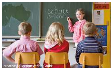
creative collection verlag GmbH