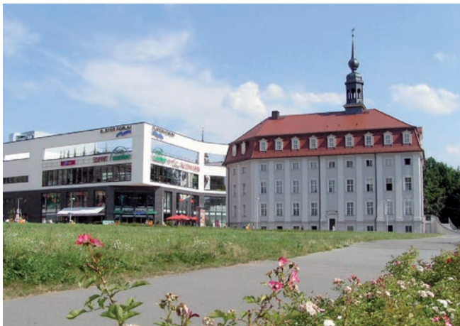
Elsterforum und Stadtmuseum

Wichtig ist zudem, sofort mit jener Krankenkasse Kontakt aufzunehmen, bei der Ihr Kind versichert sein soll. Fragen Sie Ihre Krankenkasse am besten schon vor der Geburt, worauf Sie achten sollen. Die Meldepflicht erfüllt das Standesamt für Sie.