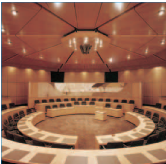
■ Ratssaal im Neuen Rathaus