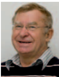
Bürgermeister Ulrich Holfleisch