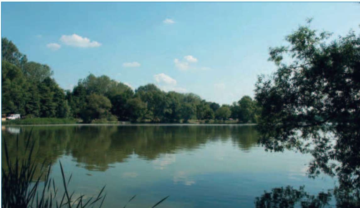
■ Am Kiessee