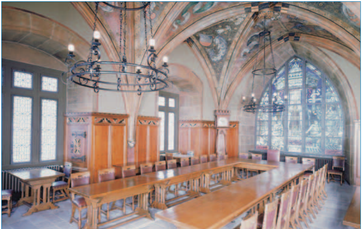
■ Ratssaal im Alten Rathaus