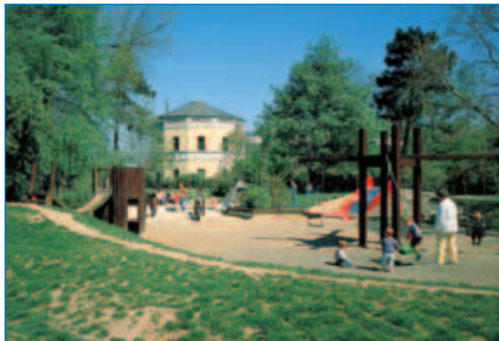
■ Spielplatz im Cheltenham-Park