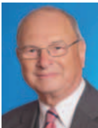
Bürgermeister Wilhelm Gerhardy