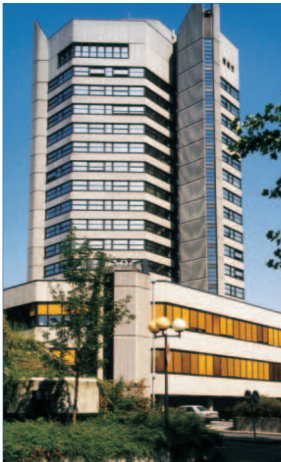
■ Neues Rathaus

Eine Diskussion mit den Mitgliedern der Ausschüsse oder des Rates findet aber nicht statt.