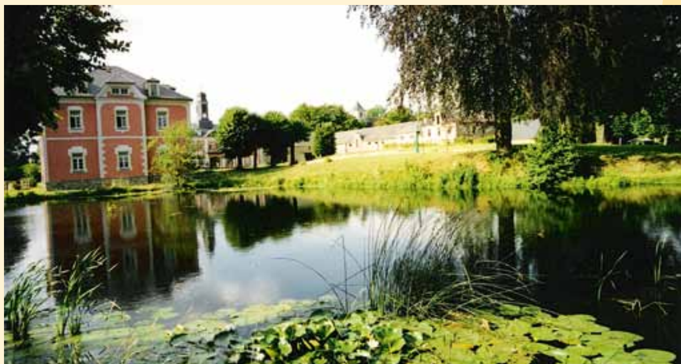
Schlossteich und Wohnanlage Rittergut