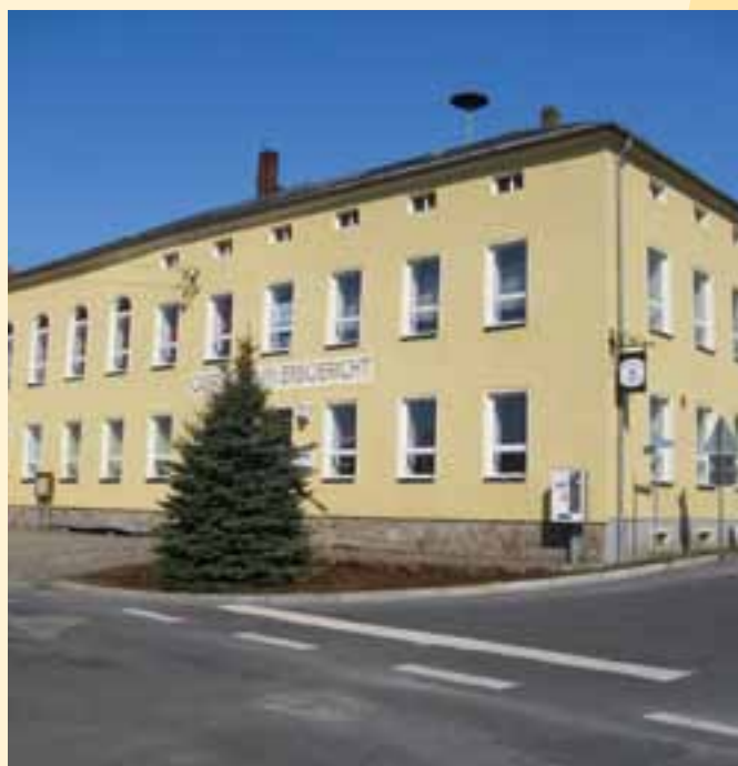
Erbgericht Seeligstadt mit Museum

Entlang der Röder erstreckt sich der Ort Seeligstadt mit einer Fläche 1648 Hektar und 853 Einwohnern in westliche Richtung. Im Norden grenzt der Ort an das Waldgebiet Massenei. Wie Großharthau wird Seeligstadt auch in einer Oberlausitzer Grenzurkunde von 1228 als Seligenstadt genannt. Die Besiedlung erfolgte durch Deutsche. Es könnte der Name des Locators gewesen sein. Der Locator war der Führer der Siedler, sein Name soll „Selingo“ gewesen sein. Aber auch eine Begräbniskapelle, die im Ort stand, könnte der Grund für die Namensgebung sein. Man deutete den Ortsnamen als „Ort der Seeligen“ oder „Ort an der Glück bringenden Stelle“. Der sächsische Kurfürst August der Starke schenkte der Kirche 1705 eine Orgel. Heute zählt die Kirche zu den schönsten unserer Gegend. Die Schule wird erstmalig 1578 erwähnt. 1975 erfolgte die Schließung und die Kinder besuchten bis 1999 die Schule in Schmiedefeld. Wie die Schule in Schmiedefeld