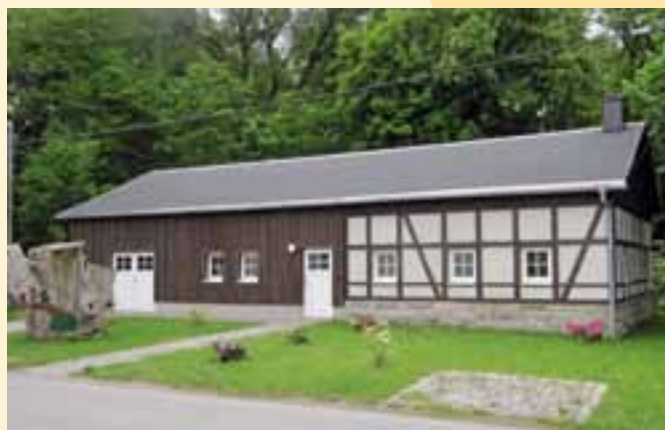
Kulturscheune am Schlosspark

Diese positive Entwicklung verdankt die Gemeinde auch der Aufnahme in das LEADER -Förderprogramm der EU. Der Trägerverein für die Region Westlausitz, Westlausitz – Regionale.Wirtschaft.Leben. e. V., hat seinen Sitz in unserer Gemeinde. Die Westlausitzer Handwerkskunst, zum Beispiel die Töpferei, der Blaudruck und die Pfefferkühlerei sind über die Grenzen Sachsens hinaus bekannt. Wirtschaftlich ist die Gemeinde gut aufgestellt. Insbesondere kleine und mittlere Handwerksbetriebe sowie Unternehmen im Dienstleistungssektor sind in den Ortschaften zu finden. Beispielsweise gibt es eine Reihe