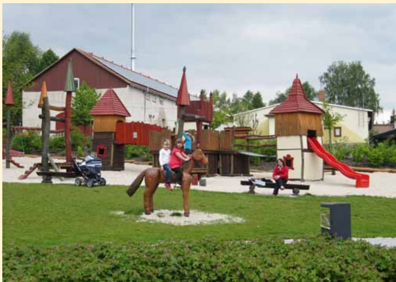
Kinderspielplatz am Schlosspark

Montag: 9.00 – 12.00 Uhr Dienstag: 9.00 – 12.00 Uhr und 14.00 – 18.00 Uhr Mittwoch: ganztags geschlossen Donnerstag: vormittags geschlossen 14.00 – 16.00 Uhr Freitag: 9.00 – 12.00 Uhr