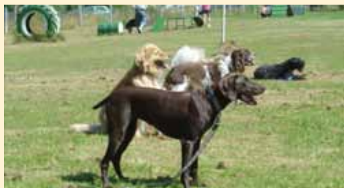
Hundeschule in Großharthau