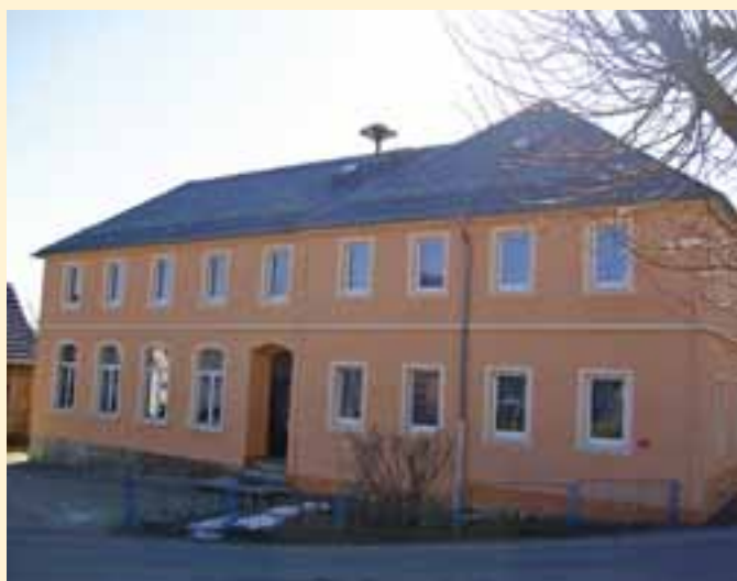
Schmiedefeld „Alte Schule“ – Bürgerhaus

Der Ort erstreckt sich mit einer Fläche von 666 Hektar und 450 Einwohnern zwischen dem Wesenitztal und der Bundesstraße 6 in westlicher Richtung. Es ist ein Wald-