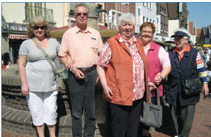
Halterner Senioren genießen den Wochenmarkt

Wenn Sie Ihren Wohnsitz verlegen wollen, ist es erforderlich, sich beim Einwohnermeldeamt Ihres neuen Wohnsitzes unter Vorlage Ihres Personalausweises anzumelden. Von dort aus erfolgt die Abmeldung an Ihren bisherigen Wohnort. Ziehen Sie innerhalb von Haltern um, ist eine Ummeldung unter Vorlage des Personalausweises im Bürgerbüro der Stadt Haltern am See erforderlich. Ehegatten oder Lebenspartner nach dem Lebenspartnerschaftsgesetz können auch ihren Partner ummelden. In diesem Fall sind beide Personalausweise vorzulegen. Bei Umzug ist darauf zu achten, dass außerdem Strom, Gas, Wasser, Telefon, Radio, Fernsehen, Zeitungsabonnements ab- oder umgemeldet werden müssen.