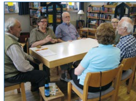
Doppelkopfrunde im Treffpunkt Josefshaus

Eine weitere Einrichtung ist in Haltern-Sythen geplant (Baugebiet Elterbreischlag).