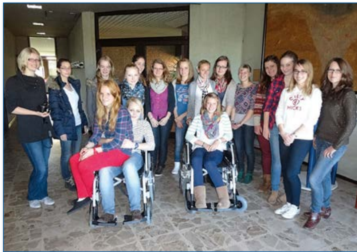
Fortbildung zur jungen Seniorenbegleitung – Kurs 2012/2013 „Die Dankbarkeit in ihren Augen zu sehen, war schön“

Kataloge können Sie direkt beim Caritasverband Haltern am See, bei allen Pfarrgemeinden und auch bei den Banken und Sparkassen kostenlos erhalten. Der Reisekatalog steht auch im PDF-Format als Download unter www.cvhaltern.caritas.de zur Verfügung.