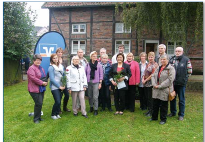
Halterner Aktionswoche 2012