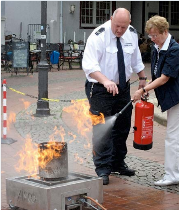
Infobörse 55plus – Richtiger Umgang mit dem Feuerlöscher