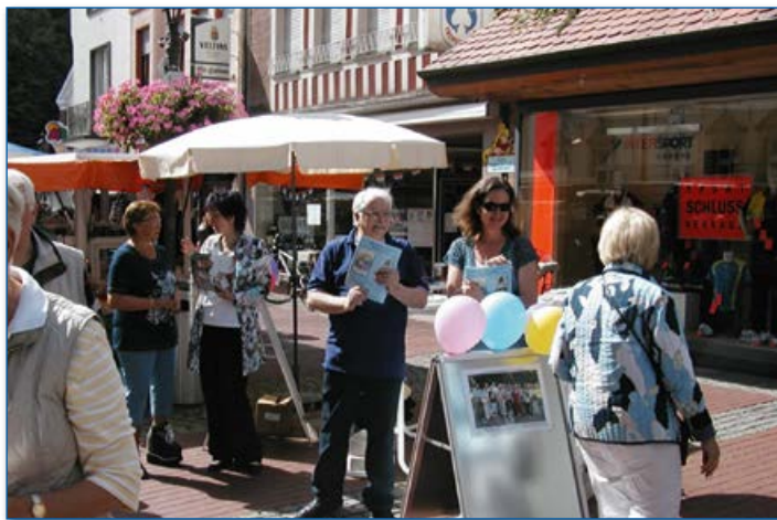
BIP, Seniorenbeirat und Wohnberatung der AWO in der Halterner Fußgängerzone

Die nachfolgenden Schaubilder und Erläuterungen sollen Ihnen einen ersten Überblick über wichtige Begriffe und Regelungen in der sozialen Pflegeversicherung geben. Wenn Sie eine umfassende Beratung wünschen, wenden Sie sich bitte an Ihre zuständige Pflegekasse. Das Beratungs- und Infocenter Pflege (BIP) der Stadt Haltern am See, ☎ 02364 933-218 oder 231, steht ebenfalls für weitergehende Fragen zur Verfügung.