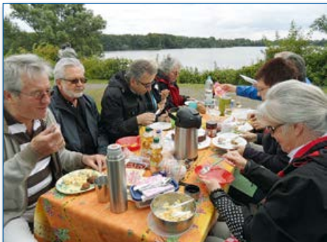
Mitglieder von „LiNa“ beim Picknick am Hullerner Stausee

Mit dem nachbarschaftlichen Wohnprojekt „LiNa – Leben in Nachbarschaft e. V.“ hat sich im Jahre 2010 in Haltern am See erstmalig ein Verein gegründet, der die Idee des gemeinsamen Zusammenlebens umsetzen möchte. Kernpunkt des Wohnprojektes ist der Wunsch, in einer selbstbestimmten Gemeinschaft auch im Alter das Leben sinnvoll und aktiv miteinander zu gestalten. Ihrem Ziel, ein gemeinschaftliches Wohnprojekt mit Wohnungen und Gemeinschaftseinrichtungen in zentraler Lage zu realisieren, ist „LiNa“ einen entscheidenden Schritt näher gekommen. Im März 2013 hat der Rat der Stadt Haltern am See einstimmig beschlossen, dass „LiNa“ und die Stadtverwaltung gemeinsam Grundstücksverhandlungen über ein zentral gelegenes städtisches Grundstück aufnehmen können.