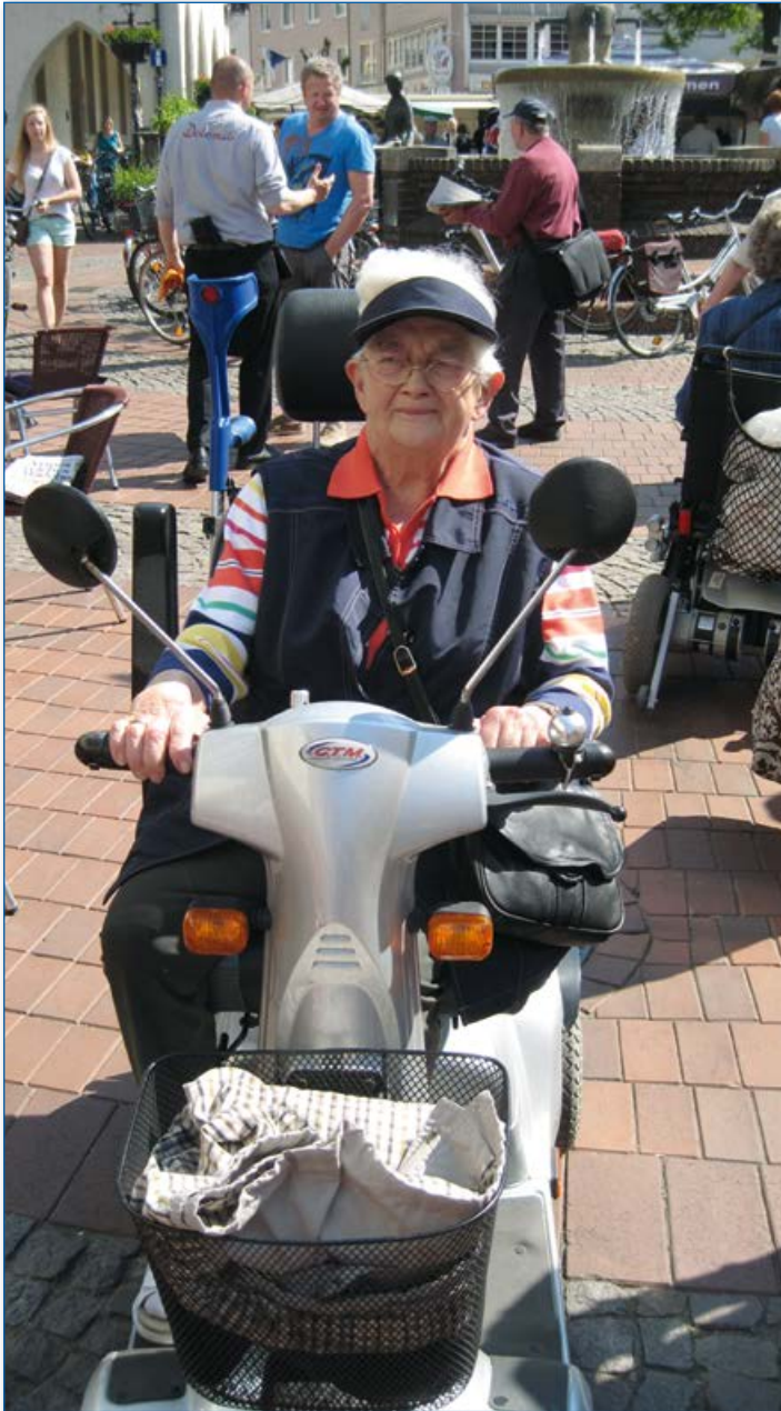
Mobil durch die Halterner Innenstadt