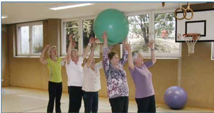
Seniorengymnastik beim ATV