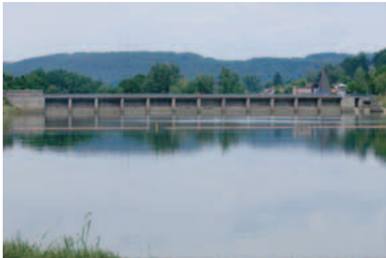
Hausgeschichts d'Happurg Landkreis Nürnberger Land