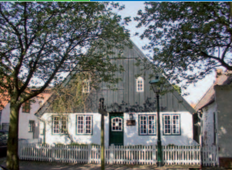
Klaus-Groth-Museum und Heider Heimatmuseum