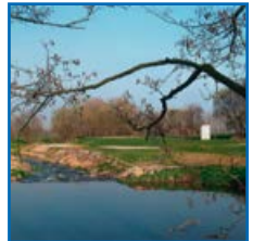
Fotos v. l. n. r.: Wehrmauer, Hort Rasselbande, Hochwassersicherung mit Fischtreppe