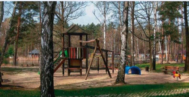
Spielplatz am Waldsee

Viele weitere Freizeitgenüsse gibt es in Horka zu erleben. Ob Neujahrssingen, Rassegeflügelshow, Sport- und Schulfeste oder Konzerte – hier macht Leben einfach Freude.