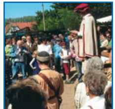
Fotos v. l. n. r.: Pferde von Horka, Dorfidylle, Historischer Markt