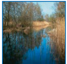
Fotos v. l. n. r.: Heiderundfahrt, Freiwillige Feuerwehr Horka, Teichlandschaft bei Horka