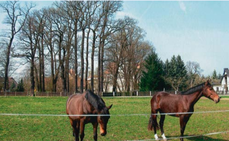
Pferde von Horka

chen. Der Umgang mit dem Partner Pferd und die Bewegung an der frischen Luft fördern das körperliche Wohlbefinden, das Verständnis für Natur und Umwelt sowie nicht zuletzt Fairness gegenüber den Tieren und menschlichen Sportkameraden", heißt es auf der Homepage des Vereins. Die Bereiche Dressur, Springen, Fahren und Geländereiten stehen aber auch den älteren Mitgliedern offen.