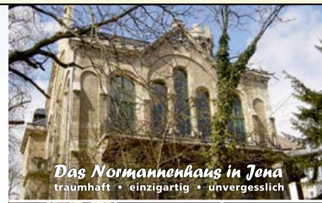
Das Normannenhaus in Jena traumhaft • einzigartig • unvergesslich

Nehmen Sie mit uns Kontakt auf, gerne stehen wir Ihnen persönlich zur Seite. Wir stehen für höchste Qualität und Perfektion – von der Planung bis zur Durchführung.