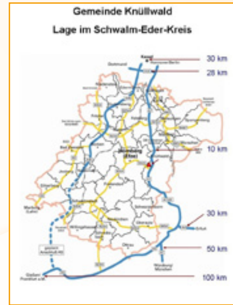
Karte: Lothar Richter

Nähere Informationen über die Gemeinde Knüllwald können Sie bei der Gemeindeverwaltung Knüllwald, Hauptstraße 7 in 34593 Knüllwald-Remfeld, Tel.: 05681 9957-0, Fax: 05681 9957-26 oder im Internet unter www.knuellwald.de einholen.