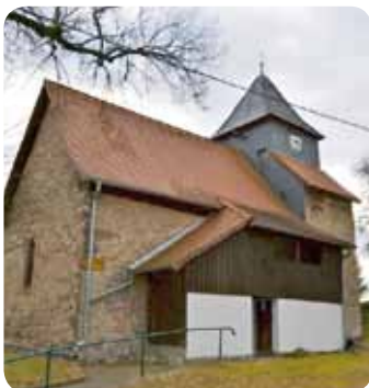
Stedten, St. Eckardt Kirche