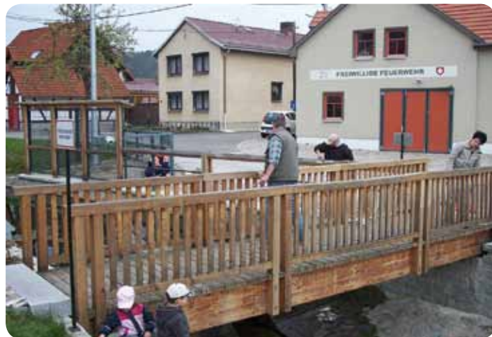
Brücke mit Feuerwehr

Für die Wander- und Radlerfreunde der Achsen Klettbach-Kranichfeld und Stiefelburg – Riechheimer Berg könnte dies ein markanter Mittelpunkt sein und gleichzeitig dem kulturellen und sozialen Leben des Dorfes entscheidende Impulse geben. Das kulturelle Leben Nauendorfs könnte diese Anregungen gut vertragen, denn trotz eines gut arbeitenden Dorfvereins (Feuerwehrverein) wären einige Bereicherungen notwendig. Neben der Kirmes im November, dem „Kiepenfest“ im September und dem Weihnachtskonzert im Dezember erschöpft sich das kulturelle Leben unseres Dorfes und wird nur noch durch einige Wohngebietsfeste im Sommer ergänzt. Wie Sie unschwer an Hand der Aufzählung erkennen können, ist es schön in Nauendorf zu leben und es ist schön, in Nauendorf Gast zu sein. Probieren Sie doch die Nauendorfer Gastfreundschaft selbst einmal aus!