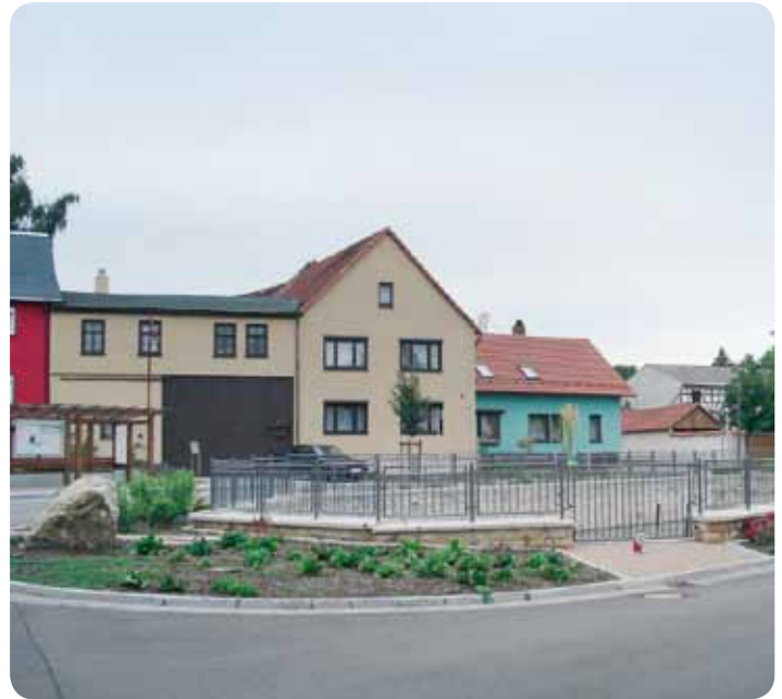
Ortsmitte Klettbach mit Teich

sich kleine mittelständische Unternehmen in Klettbach angesiedelt, diese prägen heute die Infrastruktur des Ortes.