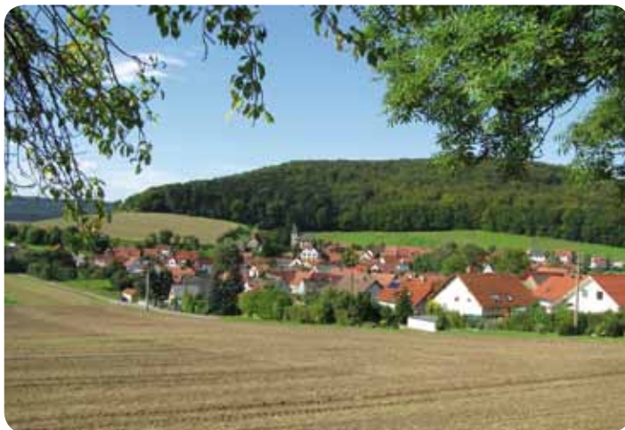
Blick auf Nauendorf

Die wirtschaftliche Struktur unserer kleinen Gemeinde wird durch ein erfolgreiches mittelständiges Unternehmen und zwei Handwerksbetriebe geprägt. Nicht zuletzt gehört die 1920 erbaute Stiefelburg zur Gemarkung Nauendorf. Von der Straße nach Kranichfeld gut erkennbar, grüßt sie weit ins Land hinein. Die Stiefelburg ist mit ihrem schönen Fachwerk und ihrer romantischen Lage ein wahres Kleinod. Für Freunde romantischen „Hotelwohnens“, aber auch für gutes Essen und gute Bewirtung ist dieses Haus der richtige Anlaufpunkt. Die gastronomische Einrichtung im Zentrum des Dorfes ist von der Gemeinde Nauendorf mit großem finanziellem Aufwand in den letzten Jahren mehrfach umgebaut bzw. saniert worden.