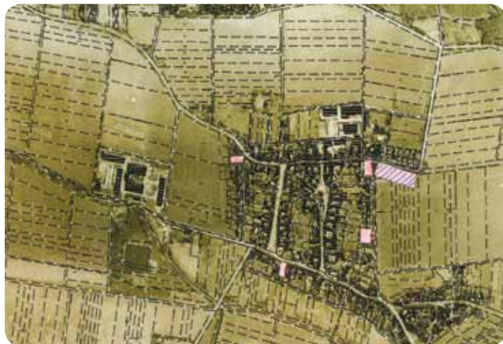
Abb. 1 – Tonndorf

Die Orte der Verwaltungsgemeinschaft liegen im ländlichen Raum. Dieser ist geprägt als eigenständiger Lebens- und Wirtschaftsraum unter besonderer Berücksichtigung der Einfügung in die Agrarstruktur. Die ausgewiesenen bauleitplanerischen Wohngebiete sind sehr gefragt und weisen im Bereich der VG eine sehr gute Auslastung auf. Verfügbare Baugrundstücke zur Deckung des perspektivischen Eigendarfes bestehen in der Gemeinde Tonndorf.