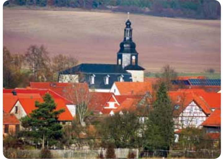
Blick auf Hohenfelden

Das beliebte Erholungsgebiet „Stausee Hohenfelden“ ist ein einzigartiger Anziehungspunkt für viele Besucher aus nah und fern. Mit dem Stausee, der Avenida Therme, dem Campingplatz mit Ferienhäusern und dem Kletterwald bietet Hohenfelden optimale Freizeit- und Urlaubsbedingungen. Der Ort hat