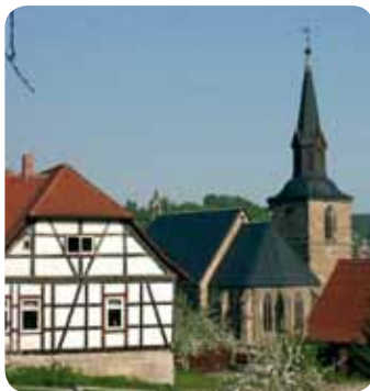
Kranichfeld, Kirche und Pfarrhaus