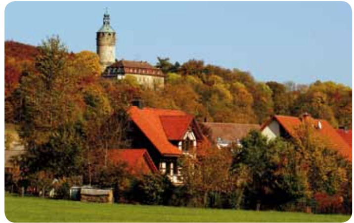
Blick zum Schlos Tonndorf

bauten Kindergarten, der Bäckerei Klausner, den vielen Gewerbetreibenden auch ca. ein Dutzend Vereine. Mit deren Hilfe sorgen die Tonndorfer für ein breites kulturelles und gesellschaftliches Leben. Viele Tonndorfer haben in der umliegenden Region Arbeit. Mit den vielen Freizeitmöglichkeiten und seiner attraktiven Lage bietet Tonndorf einen reizvollen