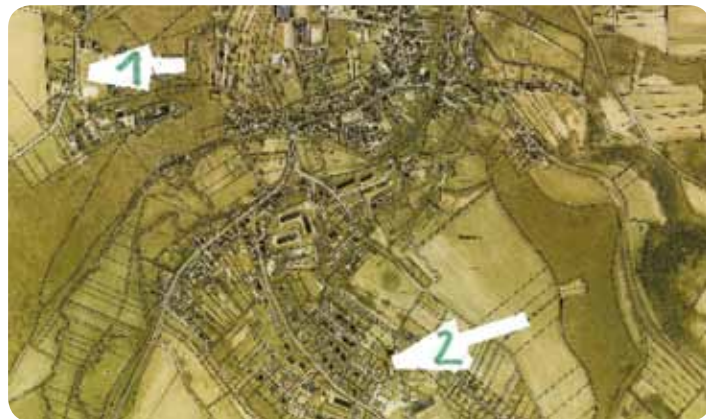
Abb. 2 – Kranichfeld

In der Stadt Kranichfeld stehen gegenwärtig einzelne Bauparzellen im Geltungsbereich eines Bebauungsplanes zur Verfügung. Reizvoll, in unmittelbarer Nähe des Oberschlusses, beabsichtigt die Stadt Kranichfeld die Veräußerung von 4 ca. 800 qm großen Grundstücken zum Zwecke der Wohnbebauung.