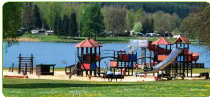
Abenteuerspielplatz Stausee Hohenfelden