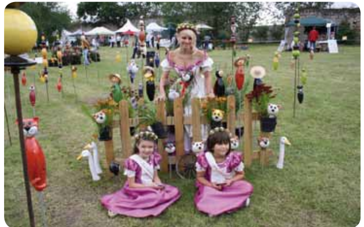
Rosenkönigin mit Blumenkindern