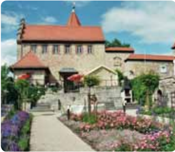
Niederburg mit Rosengarten

Zur Tradition geworden sind das jährliche Rosenfest als Kinder- und Volksfest sowie das seit 1992 im 2-Jahresrhythmus mit stattfindende Thüringer Tanzfest am 3. Wochenende im Juni. Das Burgfest zu Pfingsten auf dem Oberschloss, das Baumbachfest im September und das jährliche Mittelalterspektakel Anfang Oktober auf der Niederburg.