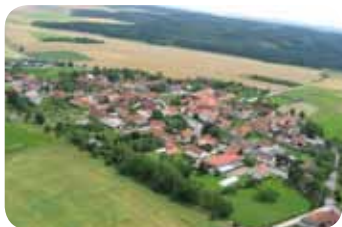
Blick auf Rittersdorf

Reine Luft, Ruhe und eine herrliche Umgebung – all das findet man im höchst geeigneten Ort des Kreises Weimarer Land, in Rittersdorf. Weit kann man bis zur Kette des Thüringer Waldes, zum Ettersberg, zu den Drei Gleichen und auf die umliegenden Ortschaften