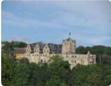
Ober Schloss mit Dicken Turm

Die Zwei-Burgen-Stadt Kranichfeld, eingebettet in das Tal am Mittellauf der Ilm, ist im Landkreis Weimarer Land und im Süden des Landschaftsschutzgebietes „Mittleres Ilmtal“ zu finden. Zurückgehend auf eine thüringisch-fränkische Besiedlung des früheren Mittelalters wird der Ort erstmals 1143