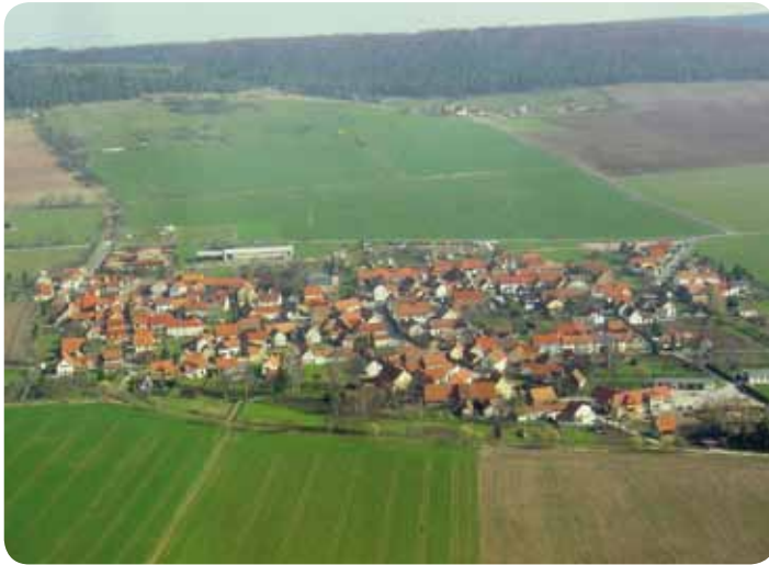
Hohenfelden aus der Vogelperspektive

Sankt Burkhard geweiht, einem treuen Begleiter des Bonifatius und Würzburger Bischof. In der heutigen Gestalt entstand sie nach dem Dorfbrand in Hohenfelden von 1810.