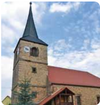
Schellroda, St. Georg Kirche