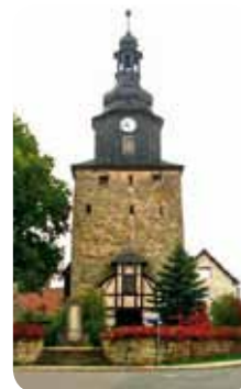
Tonndorf, St. Peter und Paul Kirche