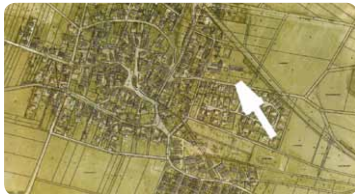
Abb. 3 – Klettbach

In der Gemeinde Klettbach besteht die Möglichkeit zur Errichtung von 4 Einzel- bzw. Doppelhäuser.