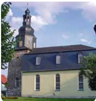
Hohenfelden, St. Burkhard Kirche