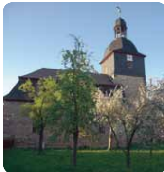
Klettbach, Kirche mit Pfarrhaus