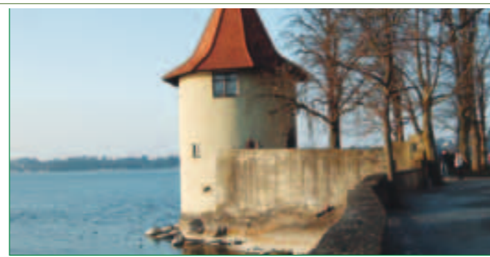
Der historische Pulverturm auf der westlichen Insel

Chelles-Allee 1 88131 Lindau/Bodensee Tel. +49 83 82 / 27 74-0 Fax +49 83 82 / 27 74-40 www.spielbanken-bayern.de