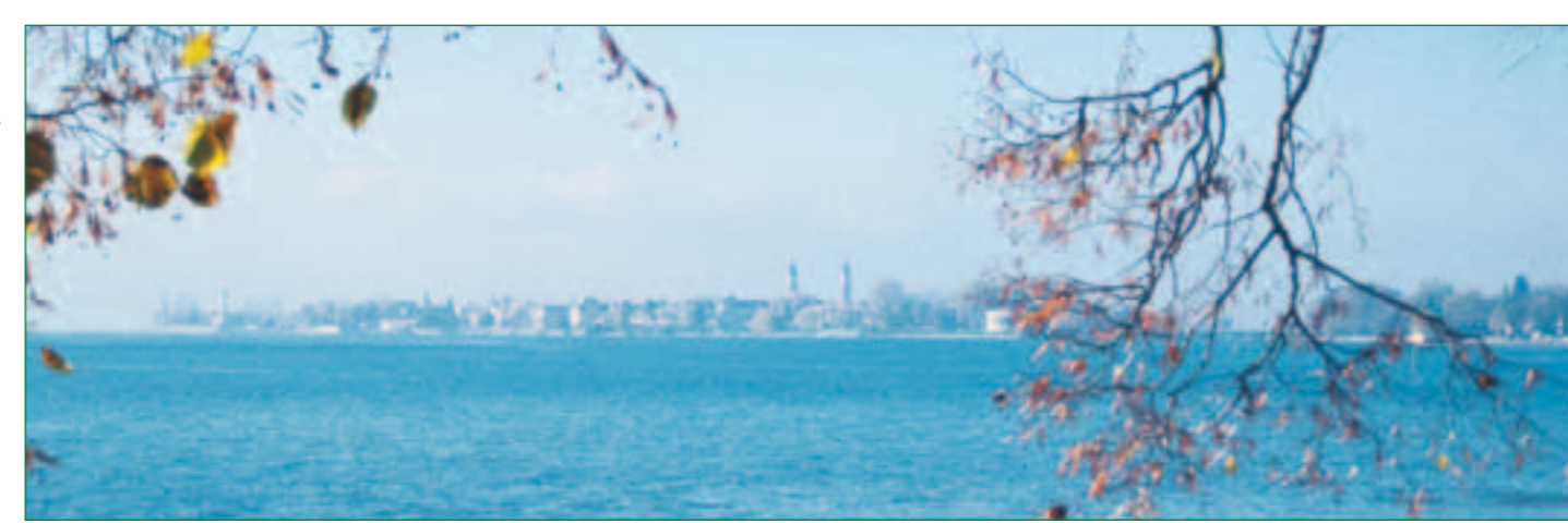
Blick auf die Insel