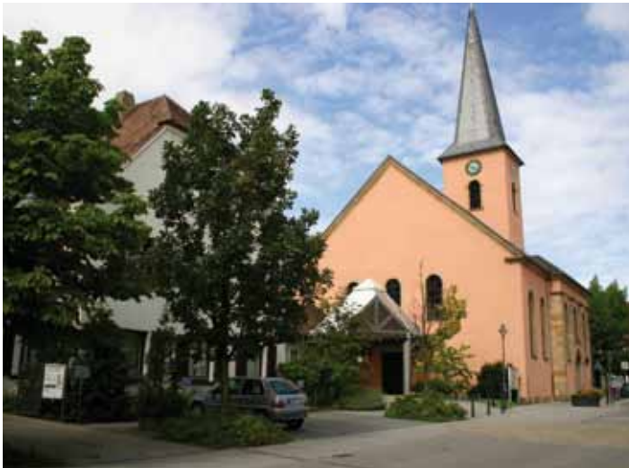
Protestantische Kirche Oppau