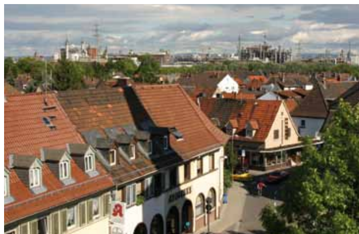
Blick von Oppau zur BASF