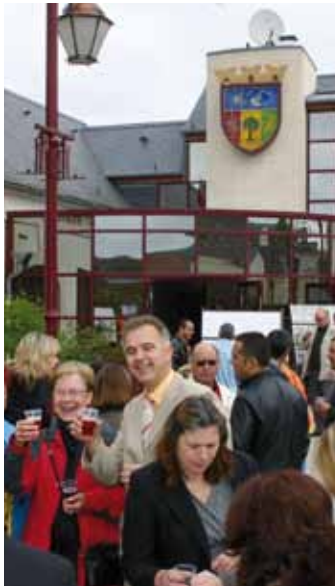
Partnerstadt Breuil le Sec