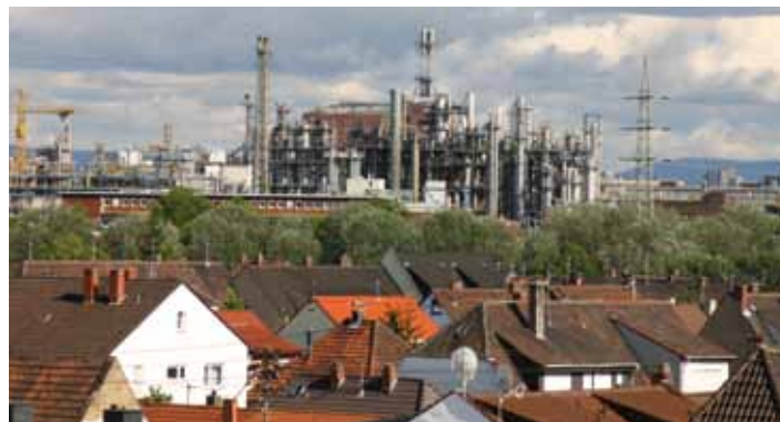
Blick über Oppau zur BASF