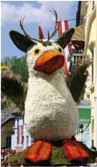
Partnerstadt Bad Aussee