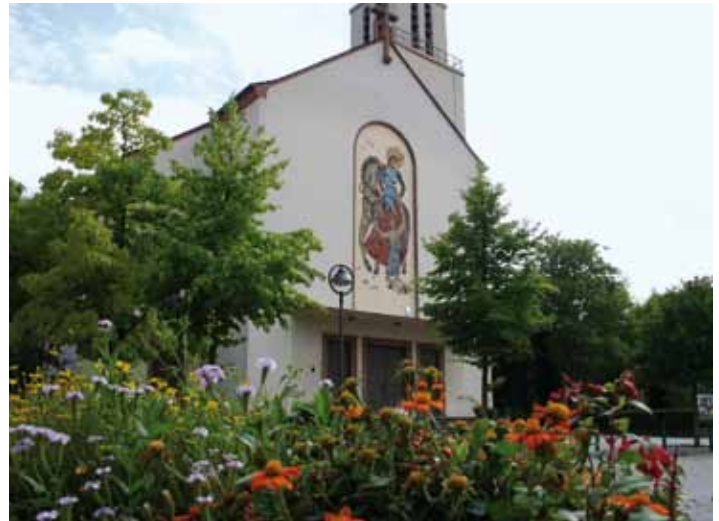
Katholische Kirche St. Martin Oppau