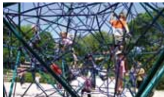
Spielplatz im Oppauer Park