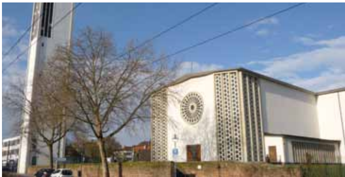
Katholische Pfarrkirche St. Sebastian

Katholische Pfarrkirche St. Sebastian Zedtwitzstraße 2 · 67065 Ludwigshafen Telefon: 0621 579290-0