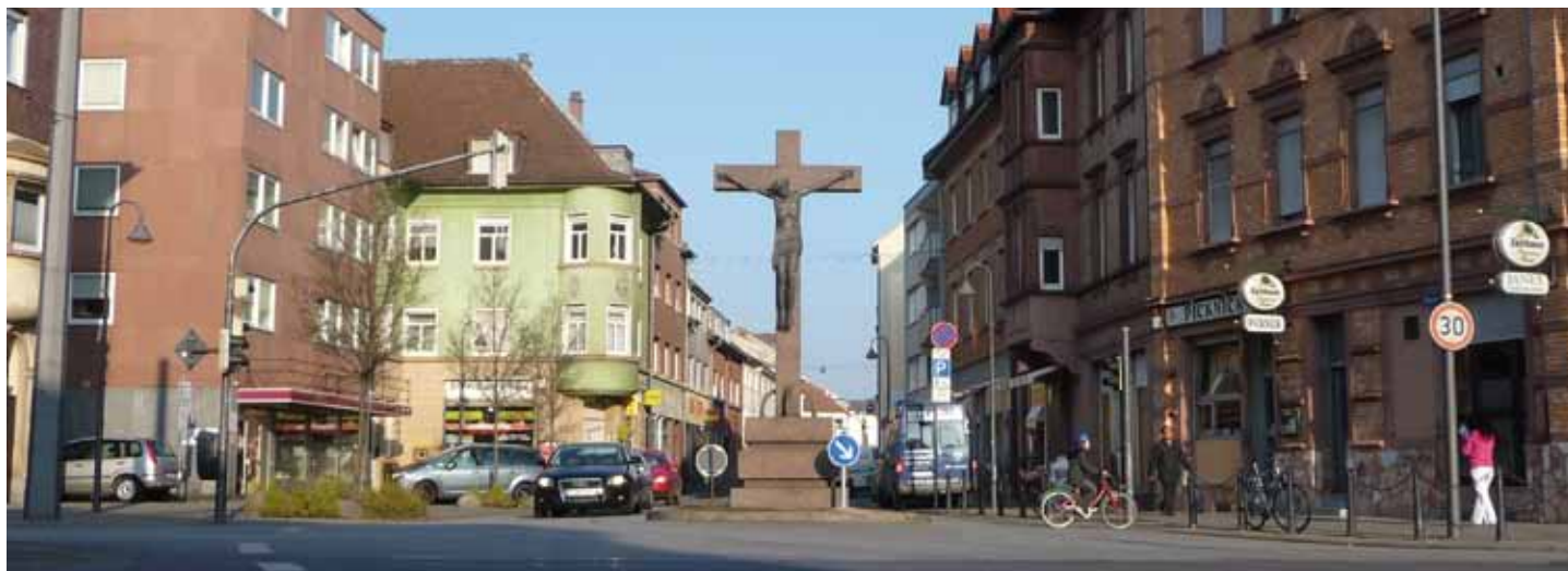
Großes Kreuz Mundenheim