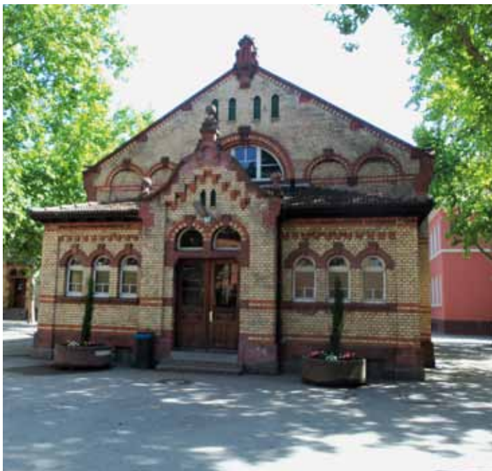
Alte Turnhalle Schillerschule Mundenheim