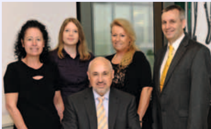
Ihr Team vom Standesamt