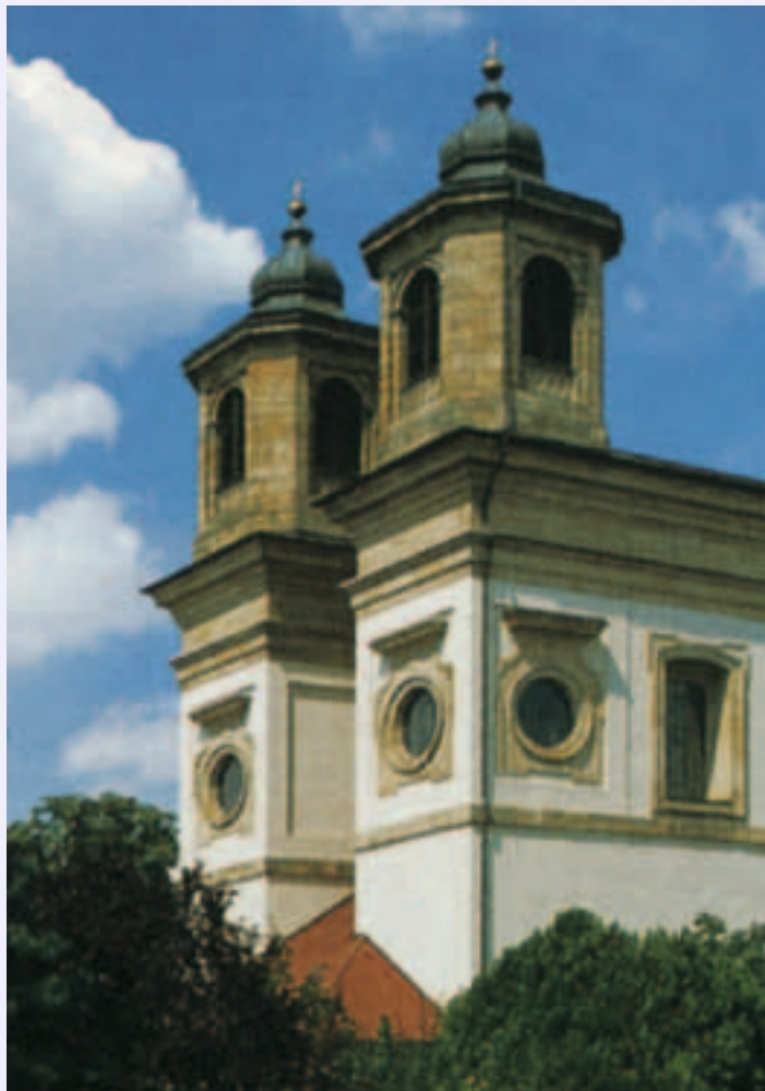
Wallfahrtskirche Maria Himmelfahrt in Oggersheim

Am Anfang steht der Kontakt mit der Pfarrerin oder dem Pfarrer. Hier kann man frühzeitig den Termin für die Trauung vereinbaren und alle weiteren Schritte gemeinsam besprechen. Dazu gehört das Traugespräch selbst, das die Geistlichen mit den künftigen Eheleuten führen. Dabei ist das Brautpaar auch eingeladen, den Gottesdienst selbst mit zu gestalten und eigene Ideen einzubringen. Die römisch-katholische Kirche bietet außerdem Ehevorbereitungsseminare an, bei denen man mit anderen Paaren gemeinsam ermutigt wird, Ehe und Partnerschaft bewusst zu gestalten.