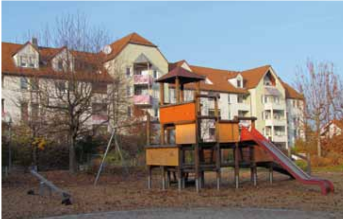
Spielplatz am Neustadter Ring