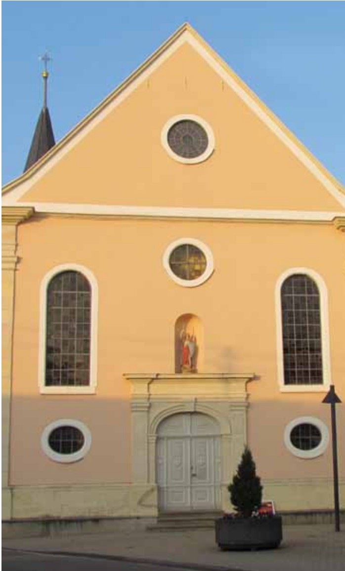
Kath. Kirche St. Michael, Von-Sturmfeder-Str. 14 a