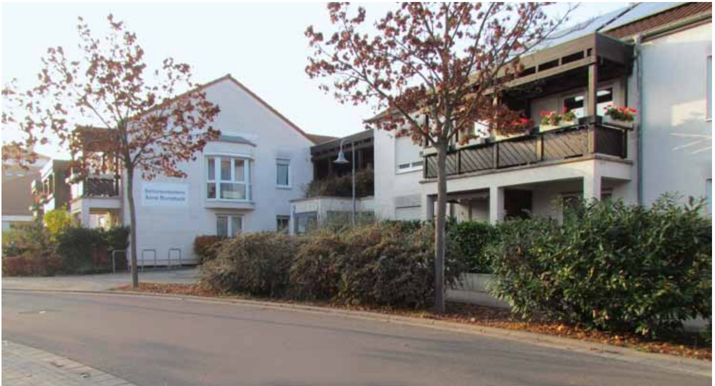
Seniorenresidenz Änne Rumetsch

Schweigener Str. 1, 67067 Ludwigshafen Tel. 0621 550050 E.-mail: swa-maudach@t-online.de