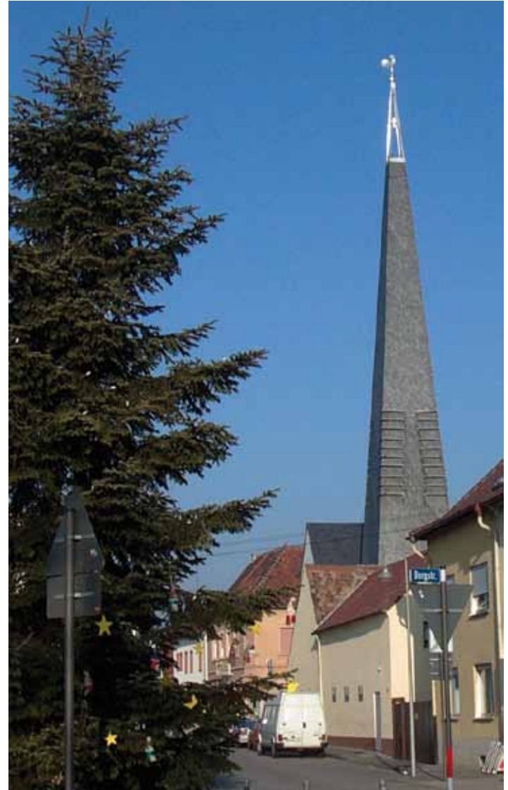
Markanter Turm der Prot. Martinskirche in der Ortsmitte, Hindenburgstraße 21