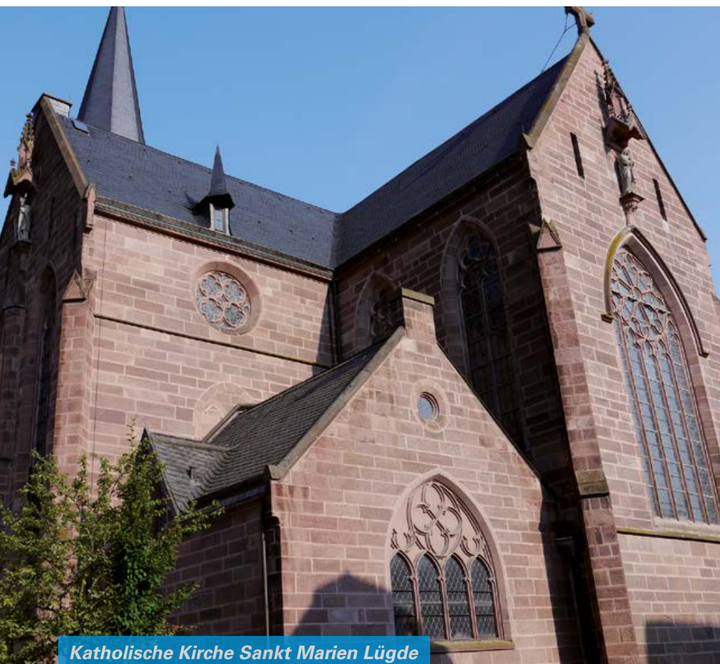
Katholische Kirche Sankt Marien Lügde