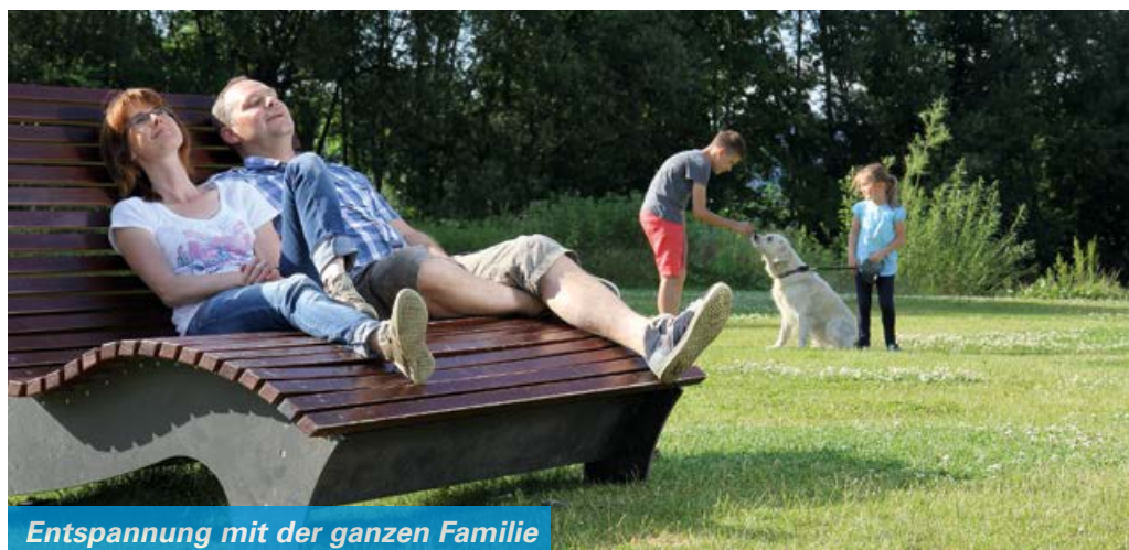
Entspannung mit der ganzen Familie