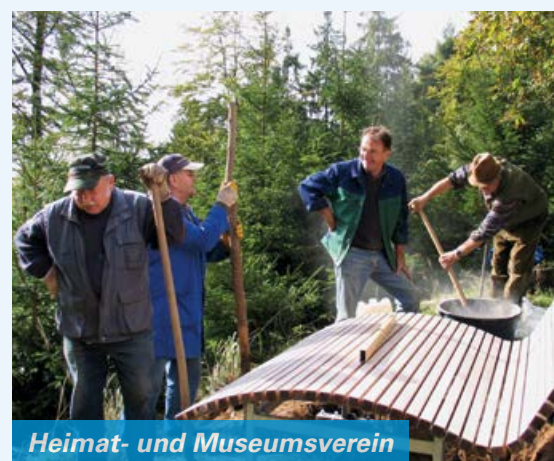
Heimat- und Museumsverein

In den diversen Heimat- und Verkehrsvereinen hat jeder die Möglichkeit sich für seinen Ort zu engagieren und zum Beispiel bei der Organisation von Veranstaltungen oder bei der Instandhaltung von Wanderwegen mitzuwirken. Die meisten Feste, Konzerte und Partys können mit der ehrenamtlichen Unterstützung der Vereine stattfinden.