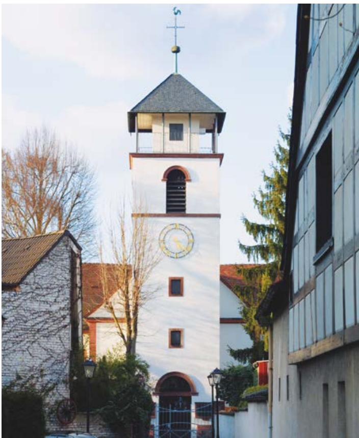
Der Turm der Evangelisch-Reformierten Gemeinde Am Marktplatz