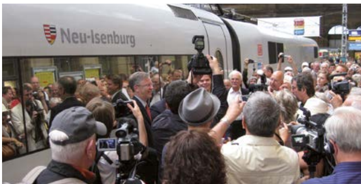
Feierliche Taufe des ICE im Hauptbahnhof Frankfurt

Er ist ein Triebzug der ersten Generation (ICE 1), dessen Flotte aus insgesamt 59 Zügen besteht und im Werk Hamburg-Eidelstedt beheimatet ist. Üblicherweise durchfährt der „ICE Neu-Isenburg“ dienstags bis donnerstags den Bahnhof von Neu-Isenburg. Dies ist die morgendliche ICE-Verbindung 1092 von Darmstadt über Frankfurt am Main nach Berlin, die zwischen Frankfurt (M) Hbf und Berlin-Spandau nonstop als ICE-Sprinter eine sehr attraktive Erreichbarkeit von Berlin für zum Beispiel Geschäftskunden aus dem Rhein-Main-Gebiet gewährleistet.