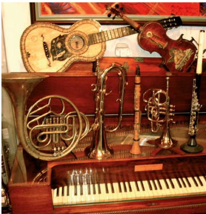
Museum im Musikhaus Göckes

Eintritt: 1 Euro pro Person, Gruppen ab 15 Personen pauschal 10 Euro