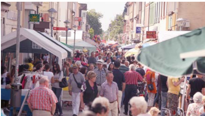
Fußgängerzone „Tag der Nationen“

Klein, aber fein – das beschreibt den Neu-Isenburger Weihnachtsmarkt treffend. Im festlich geschmückten alten Ortskern hebt sich der Markt am zweiten Adventswochenende wohlthuend von kommerziell gestalteten Weihnachtsmärkten ab. In vierzig eigens vom städtischen Betriebshof gebauten Holzhütten präsentieren Vereine und Kirchen, Kunst und Kulinarisches. Immer sind die Aussteller aus der thüringischen Partnerstadt Weida mit von der Partie. Auch das Stadt-Museum „Haus zum Löwen“ zeigt Weihnachtliches und lädt zu einem Besuch ein.