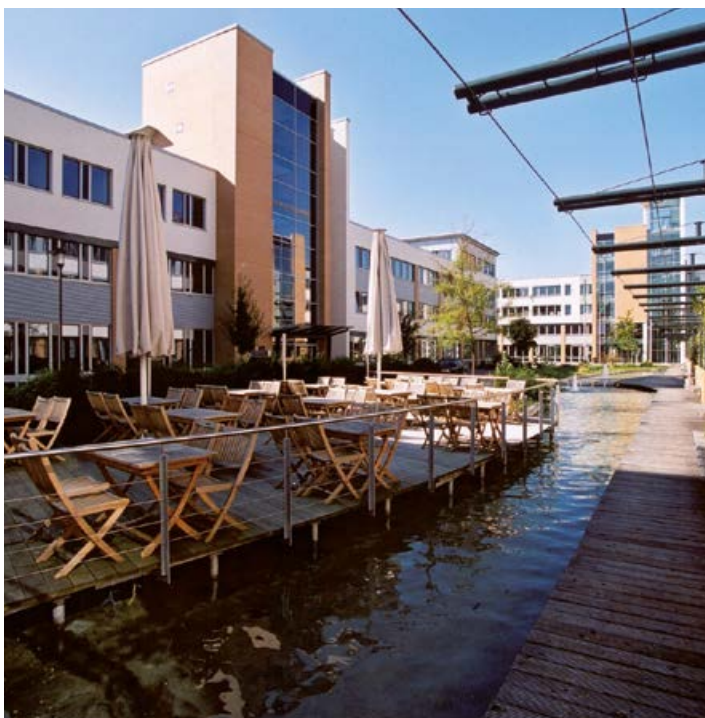
Triforum Gewerbegebiet Süd

Telefon: 06102 377337 Telefax: 06102 377337