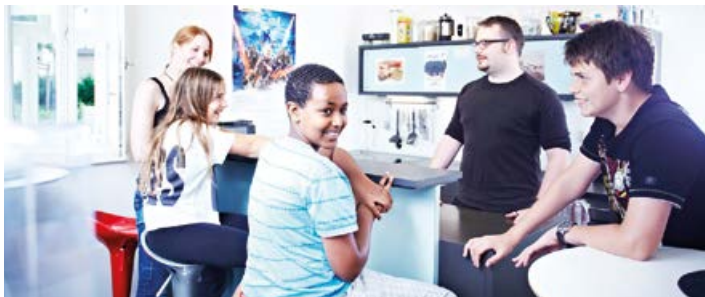
Infocafé, medienpädagogische Jugendeinrichtung der Stadt Neu-Isenburg