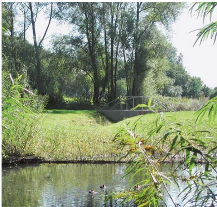
Erlenbachaue mit Bansaweier

Landschaftlich reizvoll ist die Querung des Erlenbachs, der von ökologisch wertvollen Feuchtwiesen und Auegehölzen begleitet wird. Die gesamte Aue ist Fauna-Flora-Habitat, das heißt ein Schutzgebiet für Tiere und Pflanzen. Das ökologisch wertvolle Areal ist Landschaftsschutzgebiet. Zahlreiche Apfelweinlokale laden unterwegs zum Verweilen ein. Ein Faltnblatt mit Wissenswertem zur Route, den Sehenswürdigkeiten und den Lokalen erhalten Sie im Rathaus und im Bürgeramt.