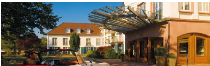
Kempinski Hotel Gravenbruch