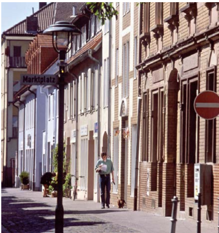
Kronengasse im Alten Ort

Zehn Tage lang steht der Rosenauplatz neben der Hugenottenhalle ganz im Zeichen von Wein und Musik. Das vielfältige Weinfest ist zu einem festen Termin geworden, nicht nur für Weinliebhaber. Man trifft sich, redet und genießt laue Sommerabende bei einem guten Glas Rot- oder Weißwein. Mit einem täglich wechselnden Live-Musik-Programm.