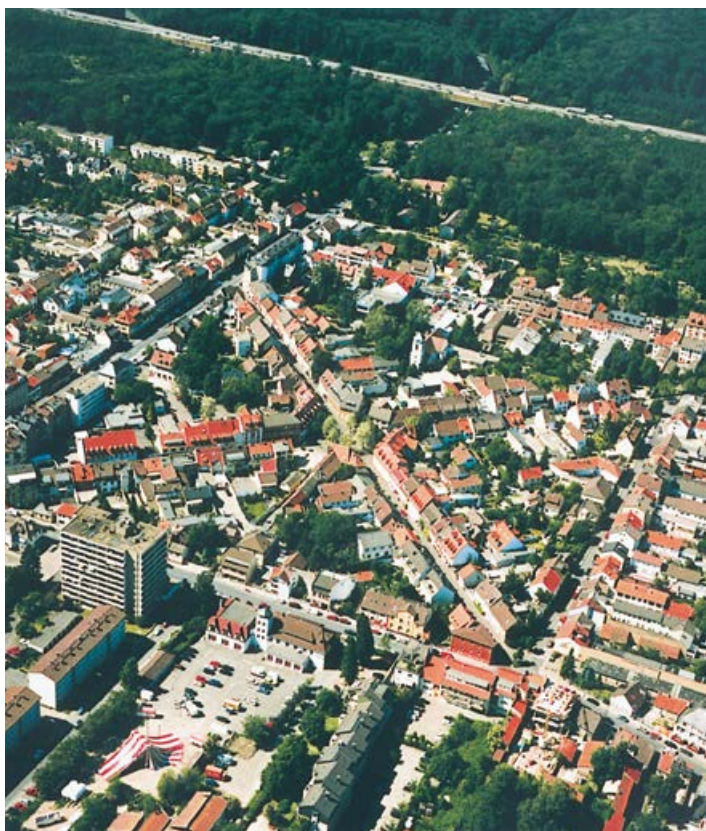
Luftbild des Alten Ortes