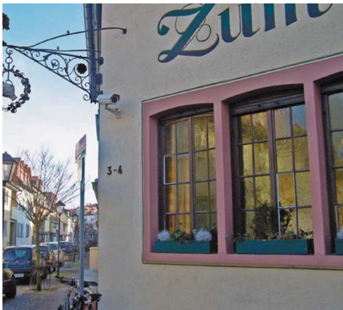
Apfelweingaststätte im Alten Ort

Auch heute gibt es hier noch einige traditionsreiche Apfelweingaststätten. Dort treffen sich die Isenburger und ihre Gäste gerne zum „Schoppepetze“, dem Genuss eines oder mehrerer Gläser oder gar Bembel des Süßen, Rauscher und Apfelweins. Den „Neuen“ gibt es übrigens in der Weihnachtszeit. Und wem dazu kein Isenburger Frankfurter Würstchen schmeckt, der probiert einen Handkäs' mit Musik.