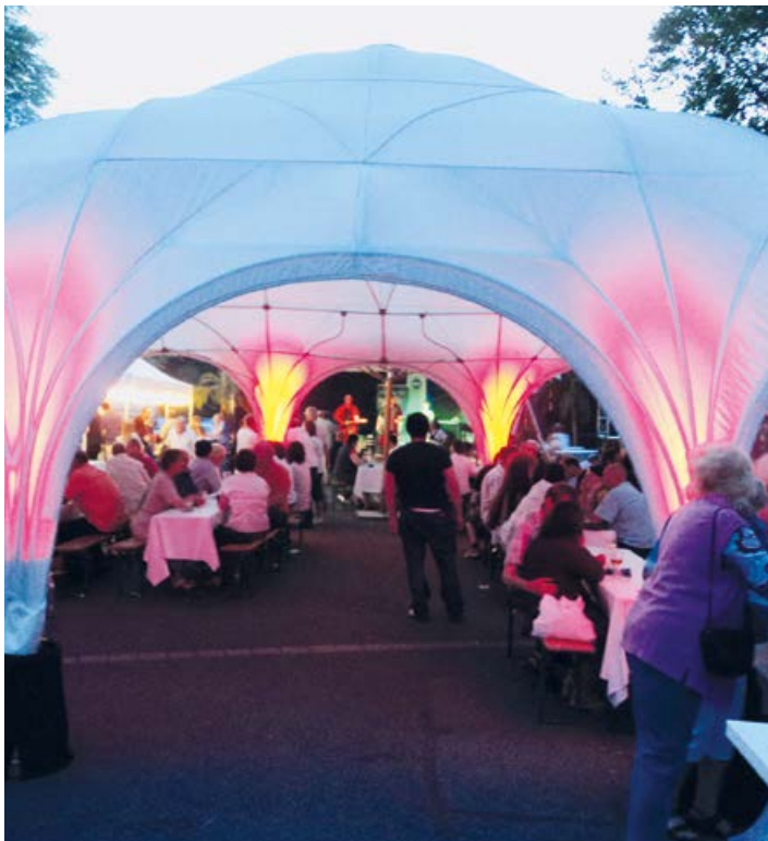
Stadtteilfest in Zeppelinheim