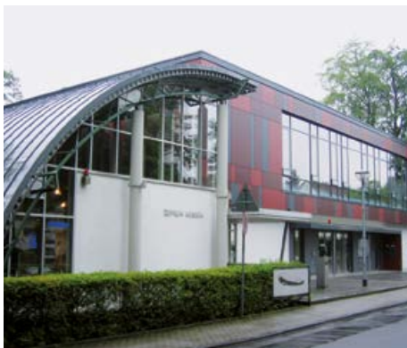
Zeppelin-Museum und Bürgerhaus

Auch die Katastrophe von Lakehurst, Brand und Untergang des LZ 129 am 6. Mai 1937, ist dokumentiert. Ein Original-Luftschiff-Motor, viele maßstabgerechte Modelle, informative Fotos und Texttafeln wurden von und mit Hilfe der „Zeppelin-Kameradschaft“ (heute: Verein für Zeppelin-Luftschiffahrt) zusammengetragen.