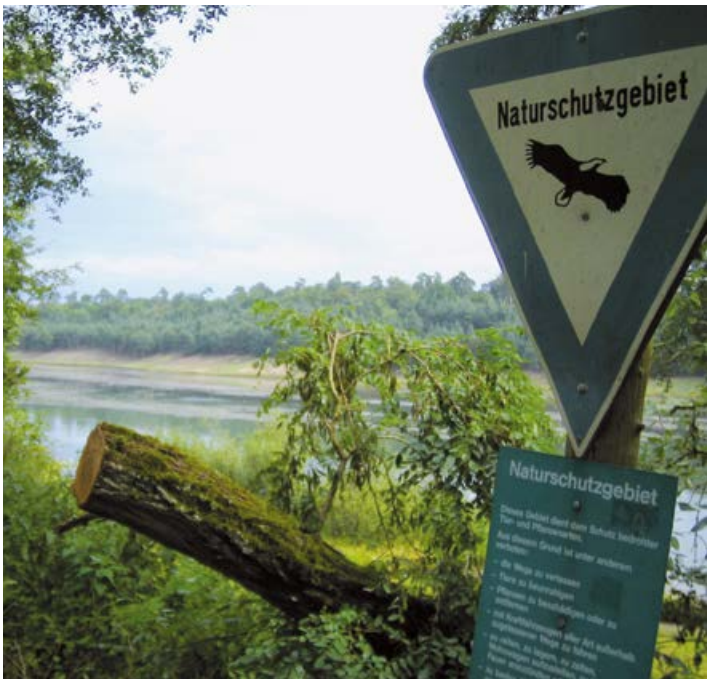
Der Gehspitzweiher ist ein geschütztes Naturparadies für Tiere

Duathlon ist eine aus zwei Disziplinen bestehende Mehrkampfsportart, die in folgender Reihenfolge absolviert wird: circa 4,5 Kilometer Laufen, circa 20 Kilometer Rad fahren und dann noch einmal etwa 4 Kilometer Laufen. Seit 2007 organisieren das Radteam Neu-Isenburg, der Isenburger Laufftreff des ITCs gemeinsam, jeweils am 1. Sonntag im November mit dem Fachbereich Sport der Stadt Neu-Isenburg die immer größer werdende Veranstaltung. Anmelden können sich alle, die sich fit genug fühlen.