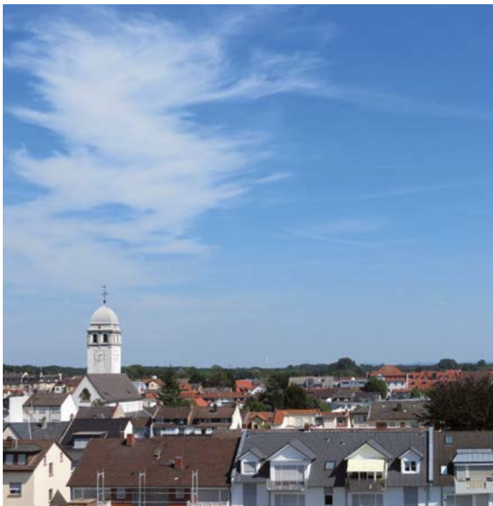
Blick auf St. Josef