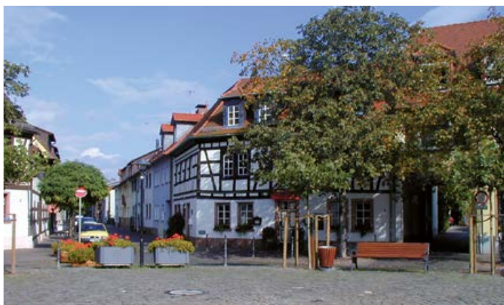
Marktplatz im Alten Ort