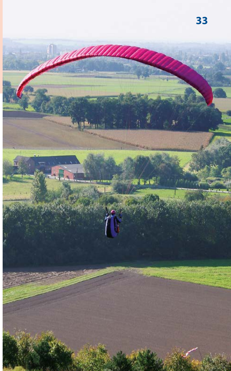
Luftsportzentrum Halde Norddeutschland

Hochstraße 5b 47506 Neukirchen-Vluyn Telefon: 02845 944111 E-Mail: redaktion@stadtradio-nv.de