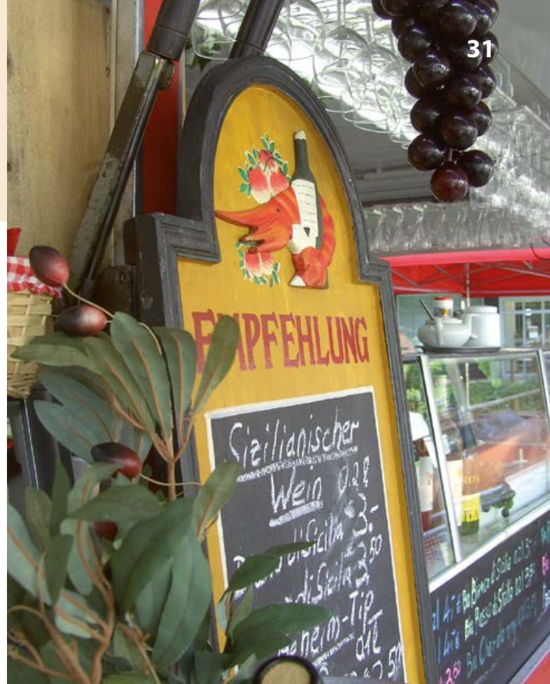
Kulinarische Spezialitäten auf dem „Vluynner Mai“

–Zweigstelle Wesel– Großer Markt 7 46483 Wesel Telefon: 0281 22048 Telefax: 0281 15737