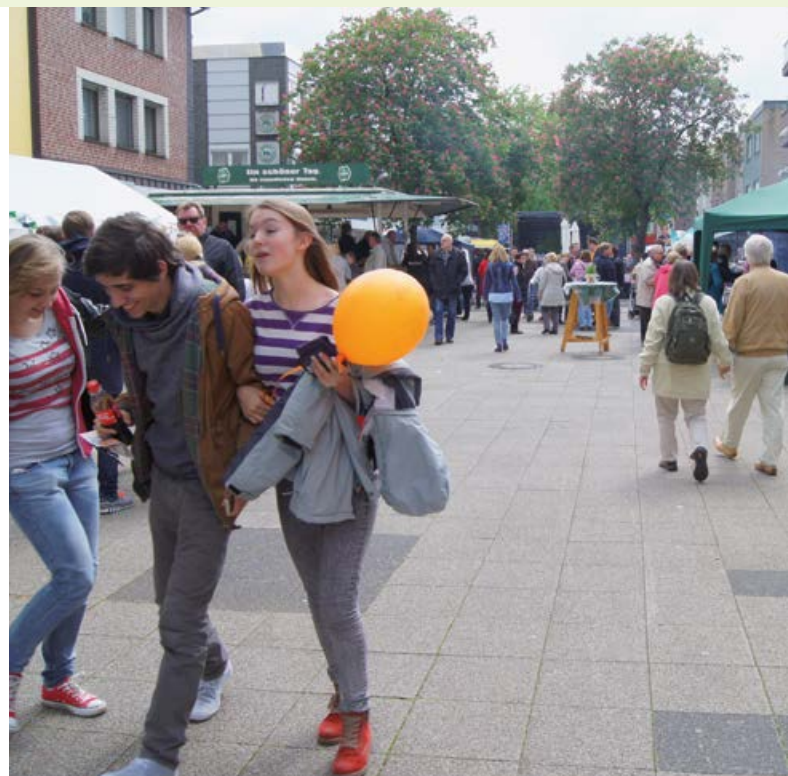
Veranstaltungen des Stadtmarketing Neukirchen-Vluyn