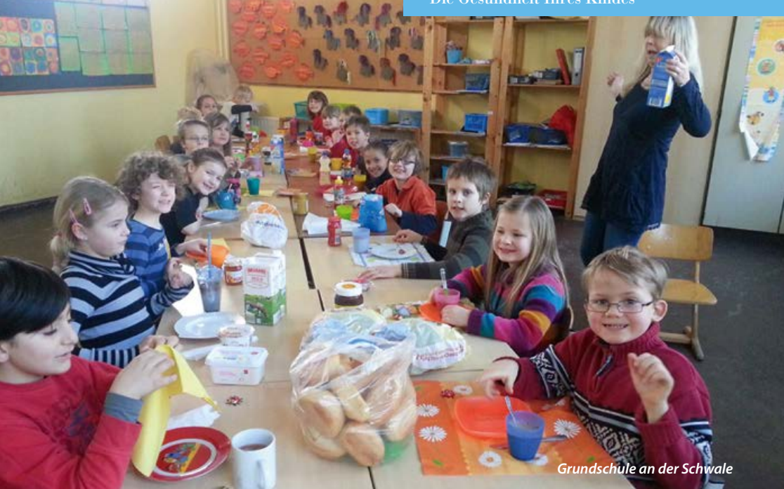
Grundschule an der Schwale