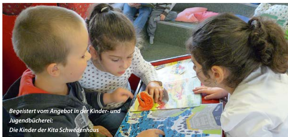
Begeistert vom Angebot in der Kinder- und Jugendbücherei: Die Kinder der Kita Schwedenhaus

betrachtet, vermittelt ihm Spaß und Freude und die Neugier, endlich einmal die Wörter der Geschichten selbst lesen zu können. Nicht viele Eltern können die Vielzahl an Büchern, angefangen von den ersten Pappbüchern, über die Bilder- und Erstlesebücher bis hin zu den Kinderromanen und Kindersachbüchern selbst kaufen. Darum gibt es die Stadtbücherei. In der Kinderbücherei finden Sie eine große Auswahl an Büchern, aber auch an Spielen – zum Lernen oder nur so zum Spaß –, an Filmen, an Computer(lern)spielen, Hörbüchern, Musik-CDs bis hin zu Zeitschriften. Nutzen Sie dieses kostenlose Medienangebot für Ihr Kind. Neben der Ausleihe bietet die Kinder- und Jugendbücherei auch zahlreiche Freizeitveranstaltungen für Kinder, wie regelmäßige Vorlesestunden, Autorenlesungen, Spielenachmittage, Theater, Ausstellungen und Ferienaktionen. Auch für Kindertagesstätten und Schulen gibt es ein breites Angebot an Büchereieinführungen und Zusammenstellungen von Medien für den Unterricht. Und natürlich finden Sie