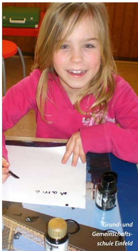
Grund- und Gemeinschafts- schule Einfeld