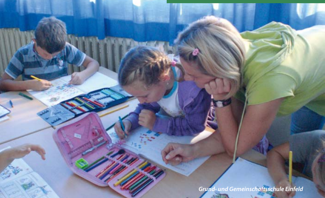
Grund- und Gemeinschaftsschule Einfeld