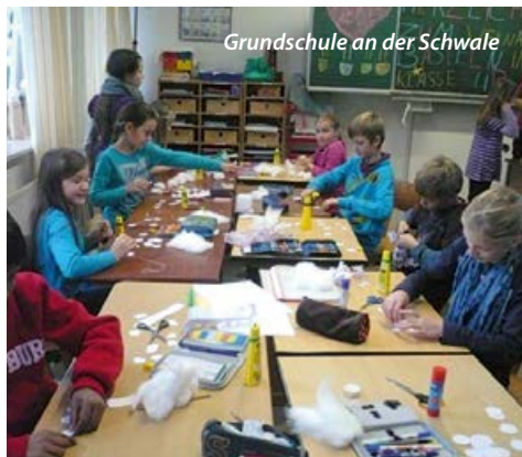
Grundschule an der Schwale

Hat sich ein Kind nicht nach Schule und Hausaufgaben einen freien Nachmittag mit den Nachbarkindern vor dem Haus verdient? Ist nämlich die ganze Woche verplant, stellt sich die Frage, ob Ihr Kind noch genügend aufnahmebereit für die Anforderungen der Schule ist. Seien Sie sich bewusst, dass vor allem die erste Klasse einen enormen Wandel für Kind und Familie darstellt. Die neuen Anforderungen sind zwar gut zu schaffen, doch sollte sich Ihr Kind darauf konzentrieren können.