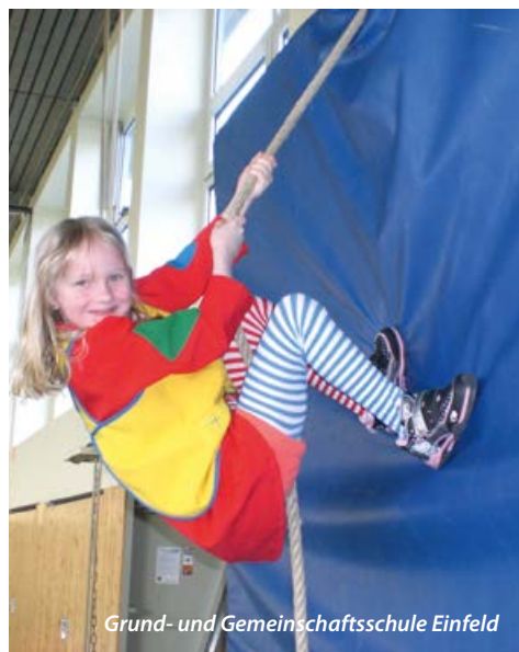
Grund- und Gemeinschaftsschule Einfeld

Jedes Kind hat seinen eigenen Rhythmus und besondere Stärken. Das eine Kind ist zum Beispiel sehr weit in der Fähigkeit, sich zu konzentrieren, ein anderes ist Meister in der Körperbeherrschung und turnt gut.