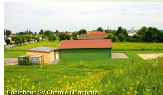
Bootshaus SV Chemie Nünchritz