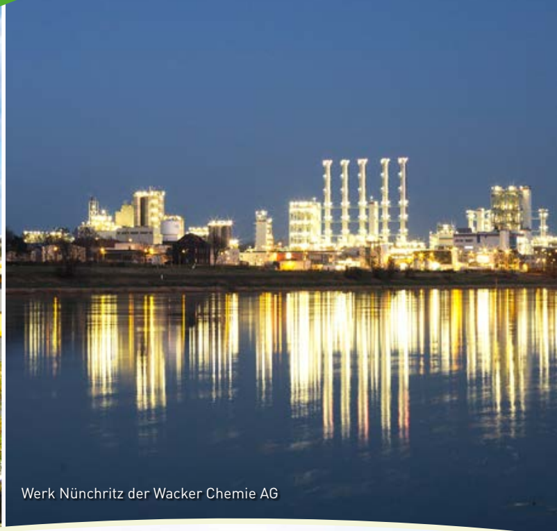
Werk Nünchritz der Wacker Chemie AG