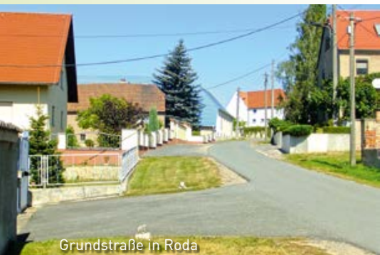
Grundstraße in Roda