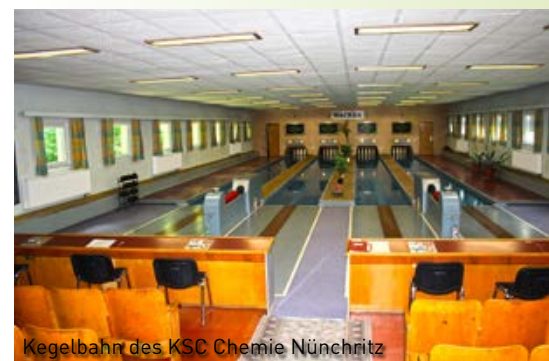
Kegelbahn des KSC Chemie Nünchritz