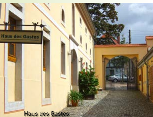
Haus des Gastes