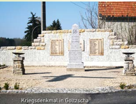
Kriegsdenkmal in Goltzscha