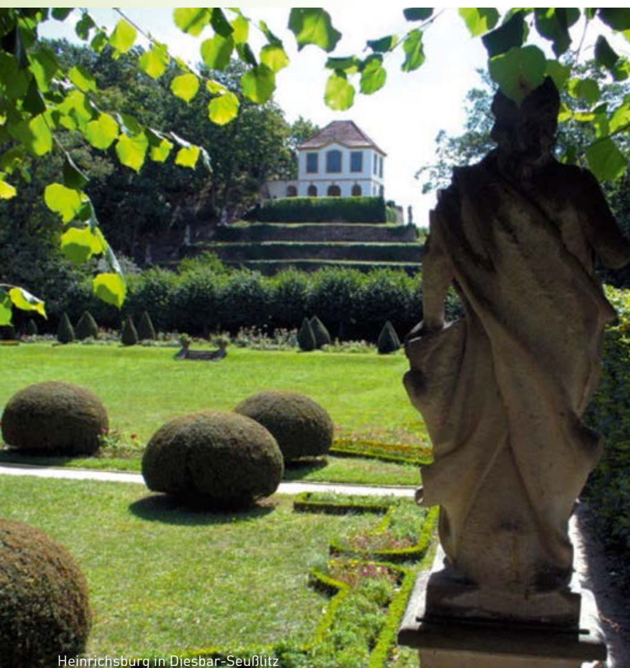
Heinrichsburg in Diesbar-Seußlitz

Poppitzer Platz 3 01589 Riesa http://haus-am-poppitzer-platz-riesa.de/