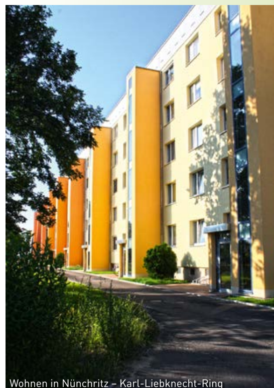
Wohnen in Nünchritz – Karl-Liebnecht-Ring