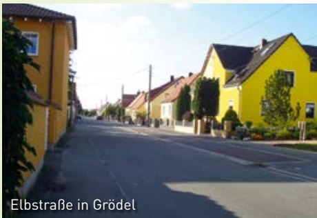
Elbstraße in Grödel