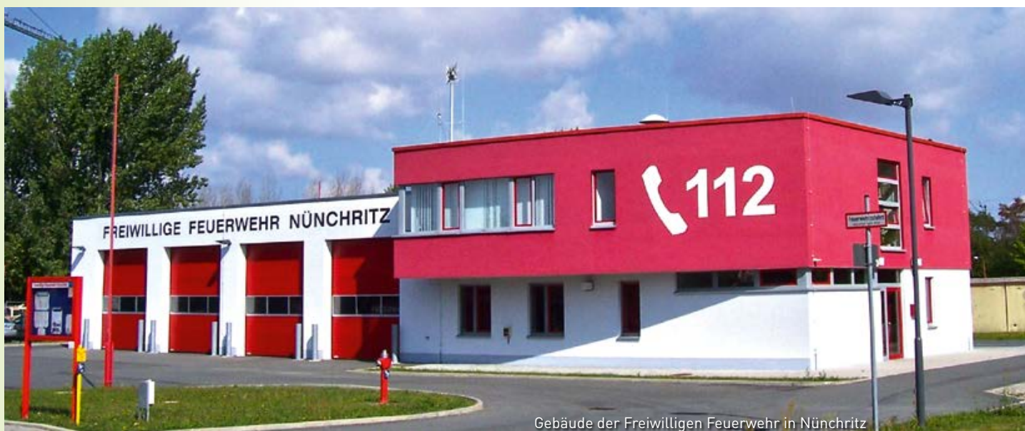
Gebäude der Freiwilligen Feuerwehr in Nünchritz