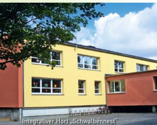
Integrativer Hort „Schwalbennest“