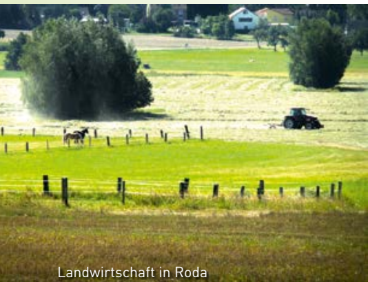
Landwirtschaft in Roda