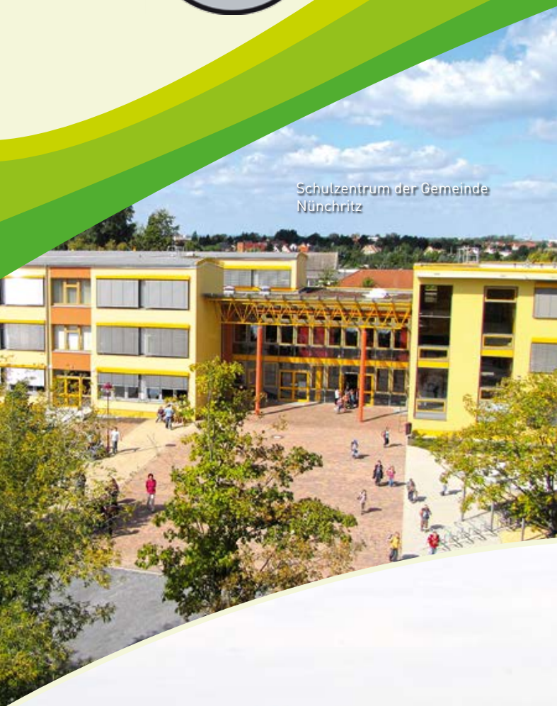
Schulzentrum der Gemeinde Nünchritz