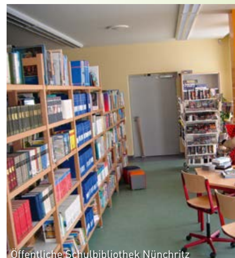
Öffentliche Schulbibliothek Nünchritz

Wir wünschen den Besuchern des Museums viel Neugier und Freude in der Ausstellung.