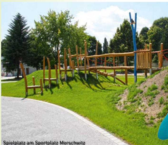
Spielplatz am Sportplatz Merschwitz