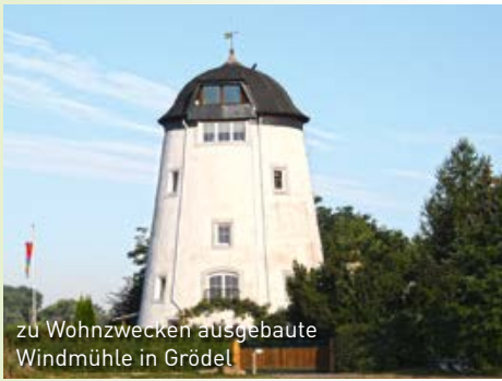
zu Wohnzwecken ausgebauter Windmühle in Grödel