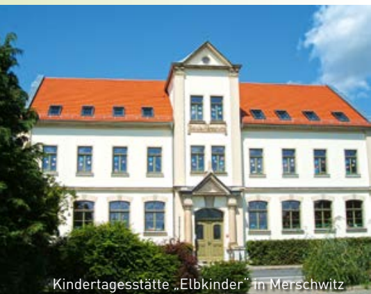
Kindertagesstätte „Elbkinder“ in Merschwitz