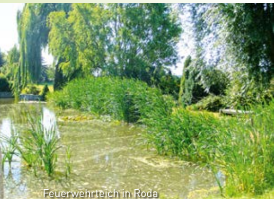
Feuerwehrteich in Roda