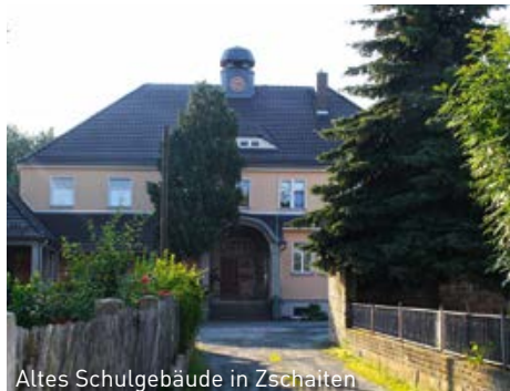
Altes Schulgebäude in Zschaiten