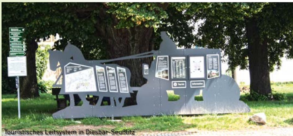
Touristisches Leitsystem in Diesbar-Seußlitz