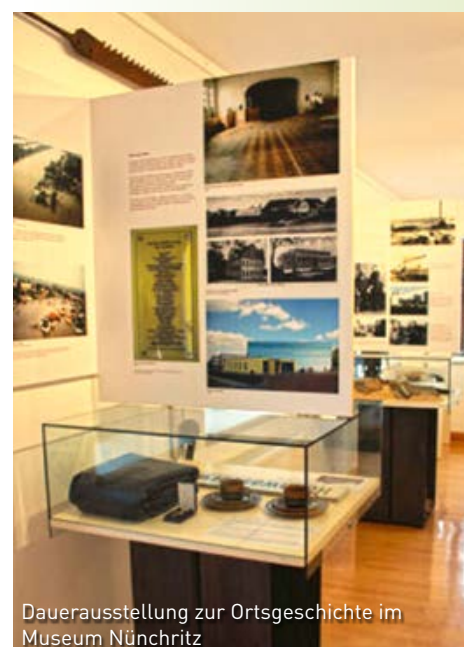
Dauerausstellung zur Ortsgeschichte im Museum Nünchritz