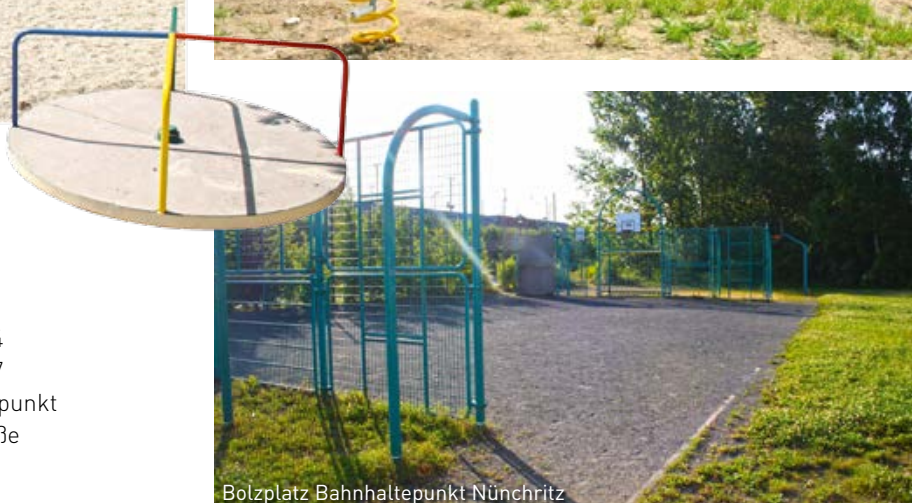
Bolzplatz Bahnhofpunkt Nünchritz