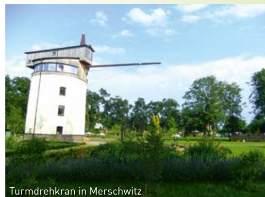
Turmdrehkran in Merschwitz

Sonstiges: Ortsfeuerwehr Merschwitz der Freiwilligen Feuerwehr Nünchritz