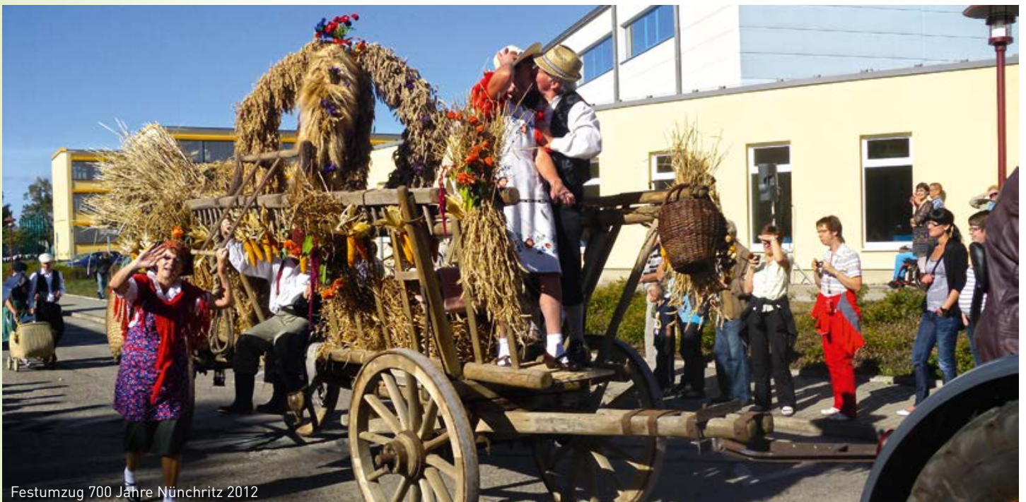
Festumzug 700 Jahre Nünchritz 2012

Sonstiges: Ortsfeuerwehr Grödel der Freiwilligen Feuerwehr Nünchritz