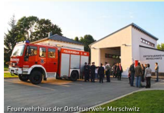
Feuerwehrhaus der Ortsfeuerwehr Merschwitz