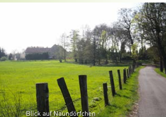
Blick auf Naundörfchen