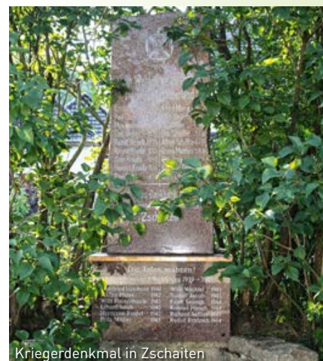
Kriegerdenkmal in Zschaiten

Infrastruktur: Großenhain und Riesa sind über die Regionalbuslinien 441 und 450 zu erreichen. Eine Bahnanbindung nach Dresden und Leipzig besteht über den Haltepunkt Nünchritz.