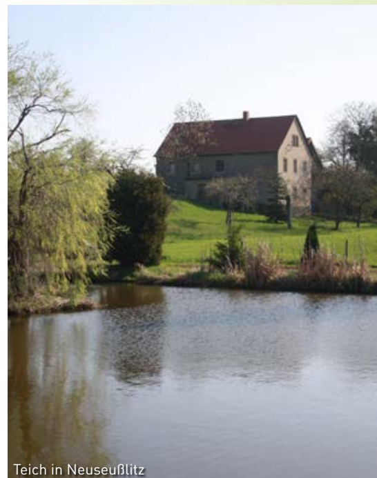
Teich in Neuseußlitz

Nünchritz steht gut und sicher auf seinen eigenen Füßen. Dem Ort mit seiner langen Geschichte ist es gelungen, über die Jahre hinweg sowohl für die Wirtschaft interessant zu sein als auch touristisch und für die Einheimischen als interessante Gemeinde angesehen zu werden.