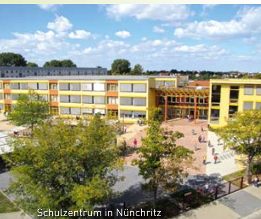
Schulzentrum in Nünchritz