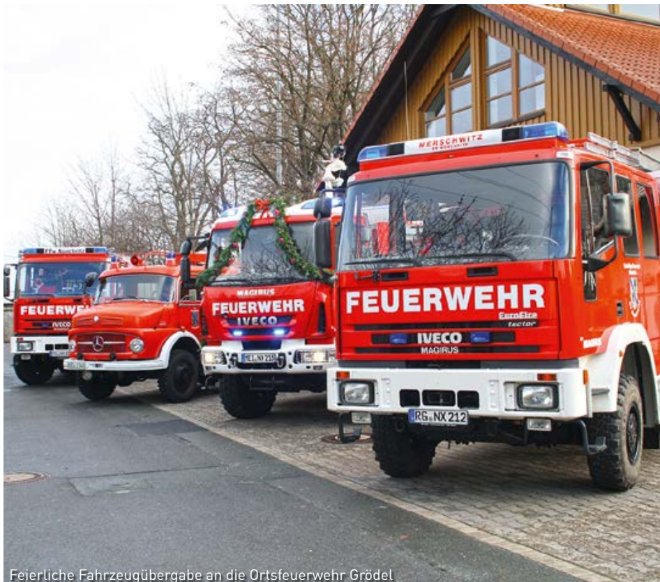
Feierliche Fahrzeugübergabe an die Ortsfeuerwehr Grödel