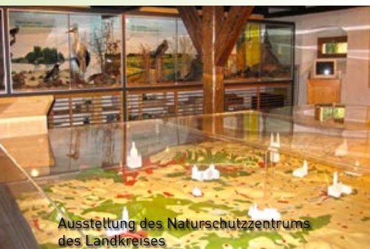
Ausstellung des Naturschutzzentrums des Landkreises