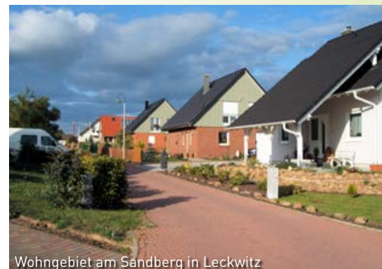
Wohngebiet am Sandberg in Leckwitz

Sonstiges: Ortsfeuerwehr Leckwitz der Freiwilligen Feuerwehr Nünchritz