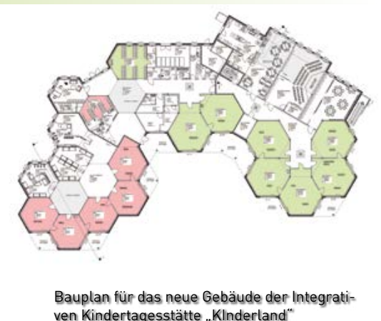
Bauplan für das neue Gebäude der Integrativen Kindertagesstätte „Kinderland“