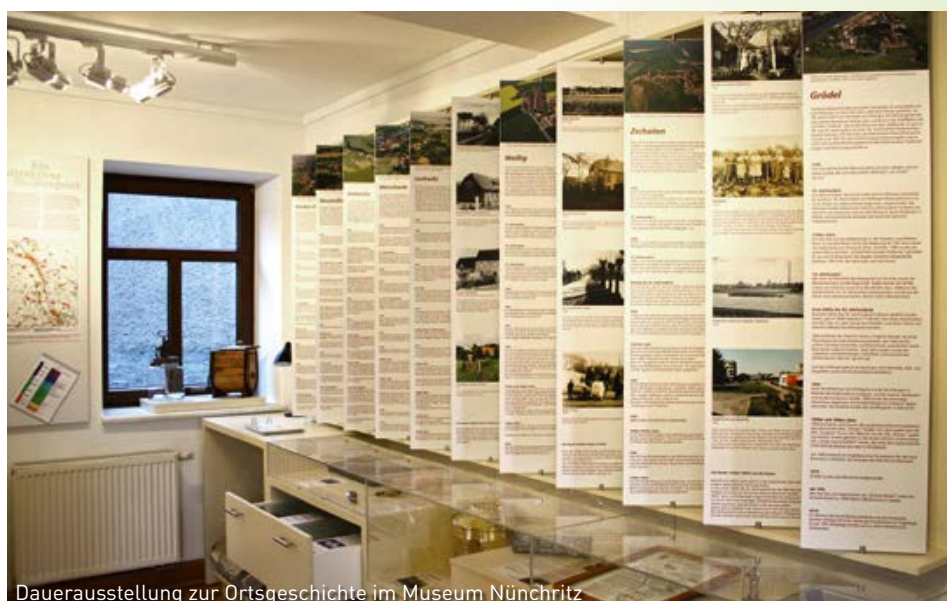
Dauerausstellung zur Ortsgeschichte im Museum Nünchritz