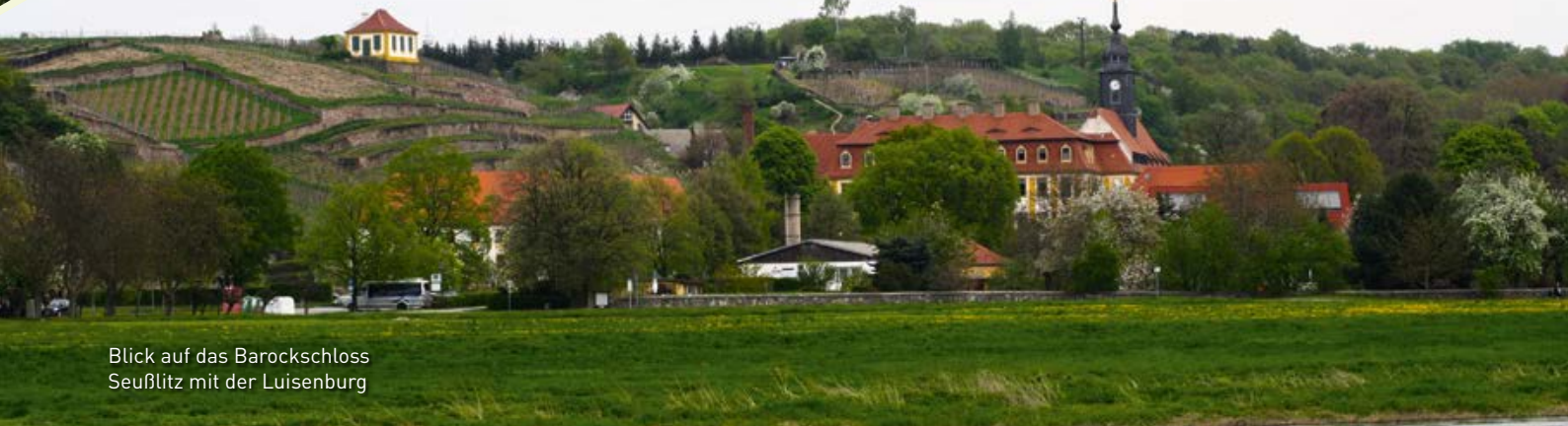
Blick auf das Barockschloss Seußlitz mit der Luisenburg