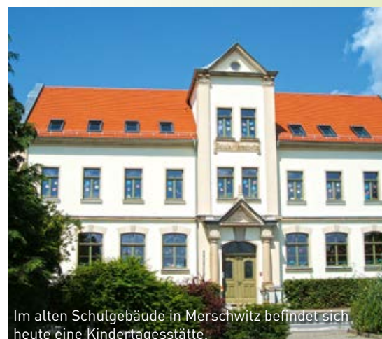
Im alten Schulgebäude in Merschwitz befindet sich heute eine Kindertagesstätte.