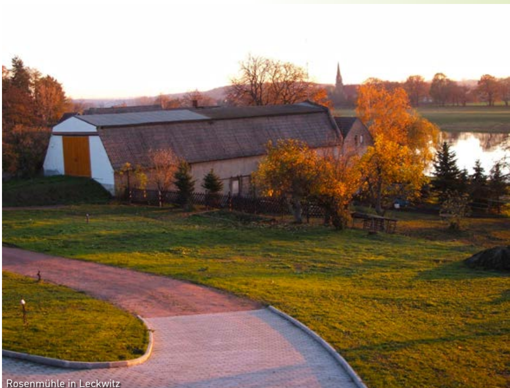
Rosenmühle in Leckwitz

Geschichtliches: Der Name kommt wohl vom altslawischen „lech“ – Biegung der Elbe. Bereits seit der Steinzeit ist das Elbufer der Region bewohnt, belegt durch Funde, die bis in die Eisenzeit zurückreichen.