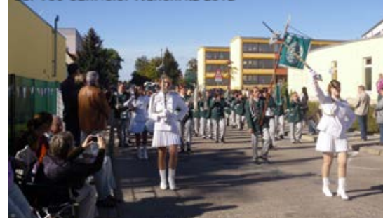
Sächsische Spielleute Nünchritz/Riesa e.V. zur 700-Jahrfeier Nünchritz 2012

Sonstiges: Ortsfeuerwehr der Freiwilligen Feuerwehr Nünchritz