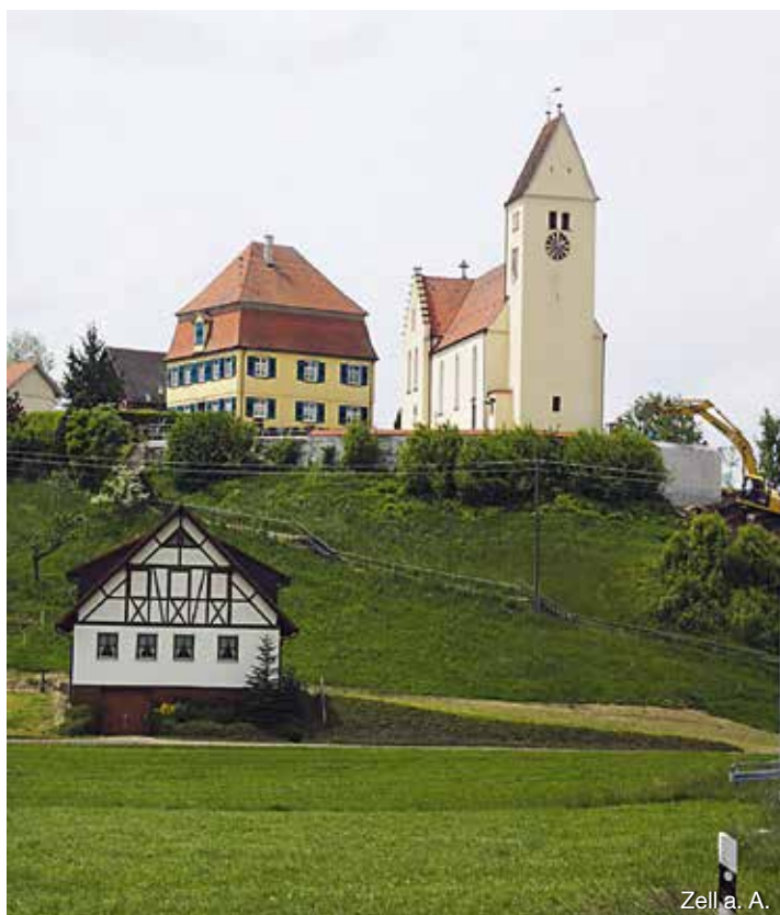
Zell a. A.