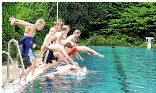
Badespaß im Freibad Stommeln