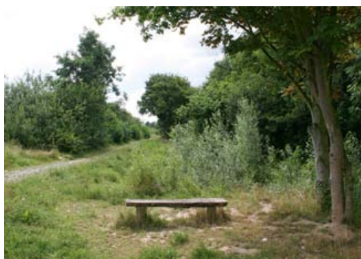
Am Pulheimer Bach

Viel Geld wird für den Ausbau und die Pflege von Fließgewässern ausgegeben. Der naturnahe Gewässerbau soll wieder eine Chance bekommen. Nach und nach werden hier frühere Entscheidungen revidiert, indem die begradigten und zum Teil durch Betonwannen fließenden Bäche durch Anlegen von Stillwasserzonen und teilweisen Rückbau renaturiert werden. Am Pulheimer Bach ist zwischen Glessen und Pulheim ein sehr schöner Erlebnispfad entstanden, der von dem Pulheimer Bachverband, der Universität Köln und vielen Pulheimer Schulen betreut wird.