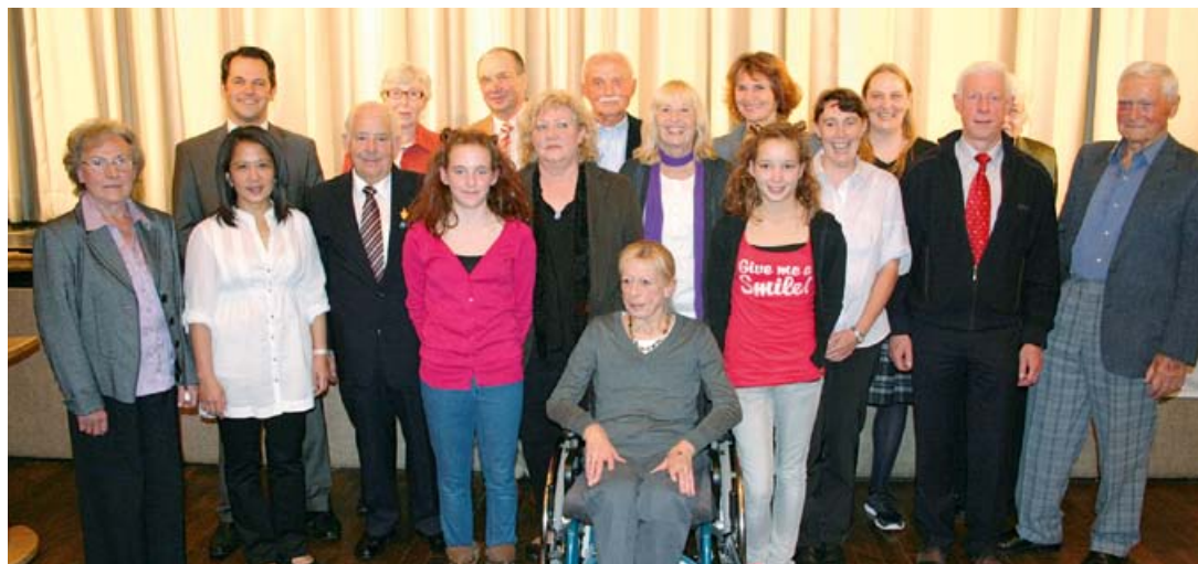
Ehrung von ehrenamtlich tätigen Pulheimerinnen und Pulheimern