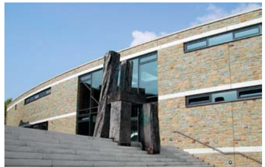
Stuhl vor der Stadtbücherei