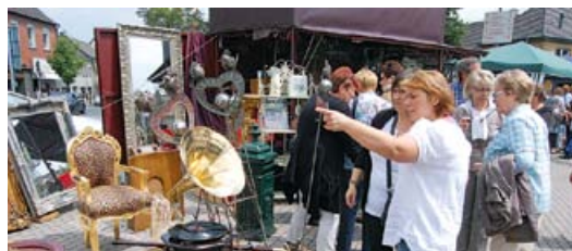
Trödelmarkt in Stommeln