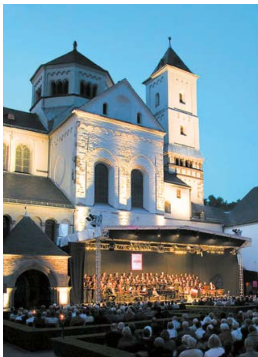
„Classic nights“ im Marienhof der Abtei Brauweiler

Das Gebiet um den heutigen Ort Brauweiler war nachweislich in der 2. Hälfte des 10. Jahrhunderts im Besitz des lothringischen Pfalzgrafen