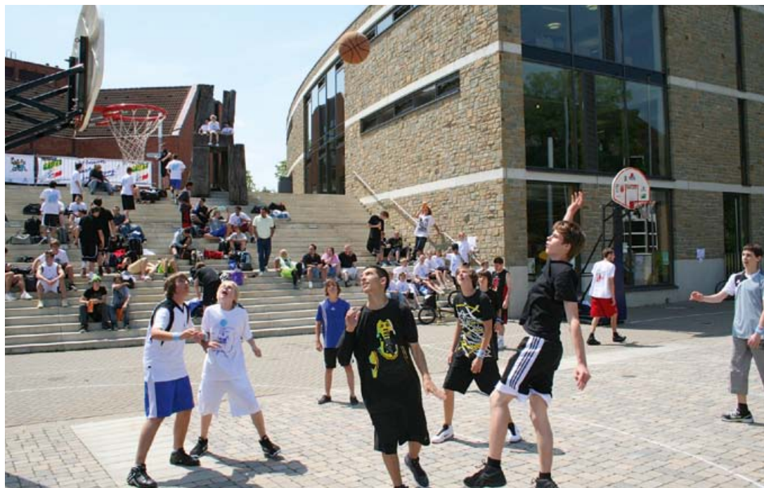
Streetbasketball auf dem Platz vor der Stadtbücherei

Jedes dreijährige Kind bekommt einen Kindergartenplatz und für die noch Jüngeren stehen mehr als 40 Eltern-Kind-Gruppen und 17 Spielgruppen zur Verfügung. 87 Spielplätze, die ständig gepflegt und erneuert werden, laden die Jungen und Mädchen in allen Stadtteilen zum Spielen ein. Jugendfreizeitstätten, Bolzplätze, Beachvolleyball-, Streetbasketball- und Skateranlagen sowie Spielstraßen ergänzen das Angebot. Die Stadt sorgt mit ihren Einrichtungen und Freizeitmaßnahmen für ein vielfältiges und breit gefächertes Angebot für Kinder und Jugendliche.