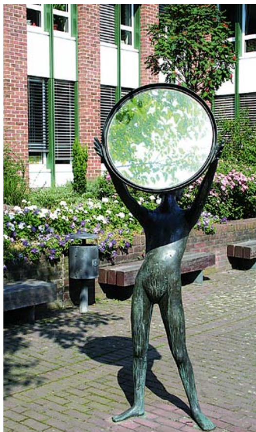
„Lichtempfänger“ im Rathaus Innenhof

für ca. 60.000 Menschen und mit dem höchsten Kaufkraftniveau aller Städte im Rhein-Erft-Kreis ist Pulheim ein wichtiger Markt.