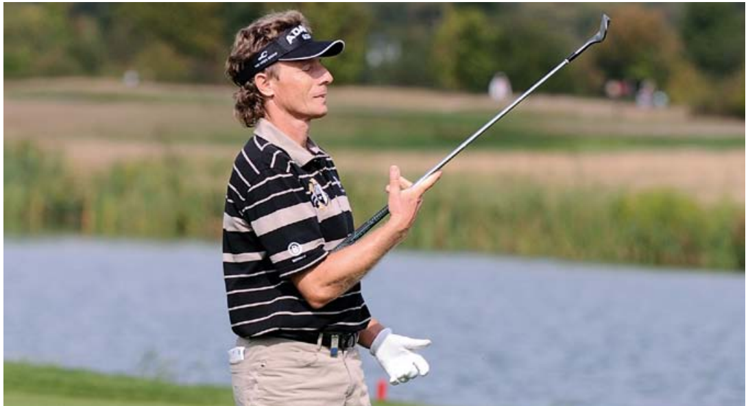
Golfstar Bernhard Langer im Golfclub Gut Lärchenhof in Stommelerbusch

Berichterstattung darüber in den nationalen und internationalen Medien hat den Bekanntheitsgrad der Stadt erheblich gesteigert.