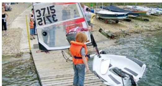
Segeln und Surfen auf dem Pulheimer See