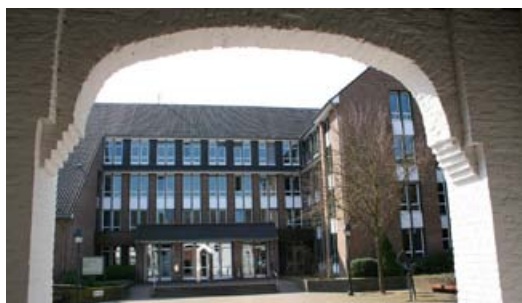
Eingang zum Rathaus