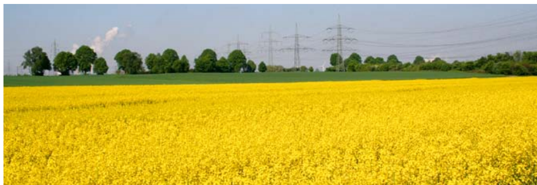
Im Nordpark Pulheim