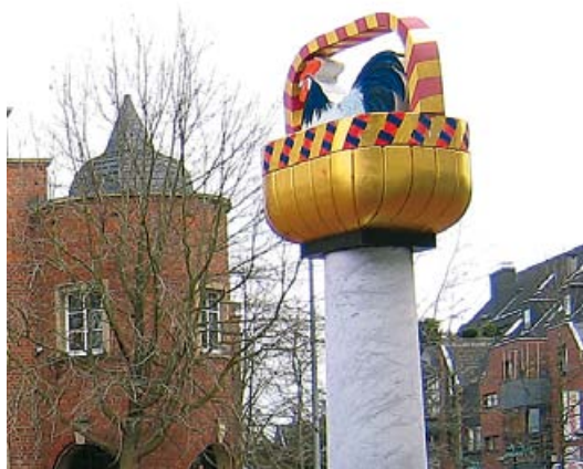
Hahn im Korb

Hauptstraße 75 50259 Pulheim-Stommeln Telefon 0 22 38/2659