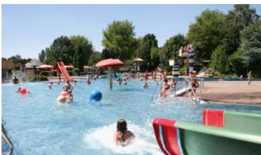
Im Freibad Stommeln