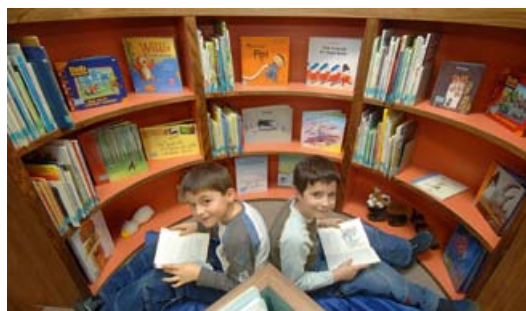
In der Stadtbücherei