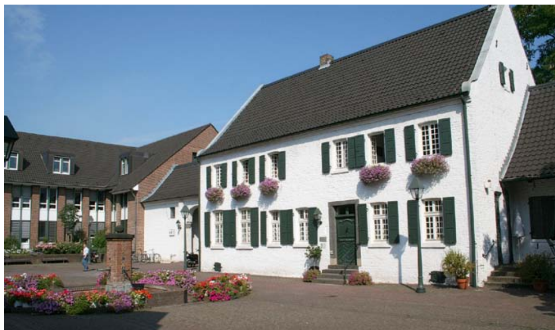
Im Canishof befindet sich das Standesamt