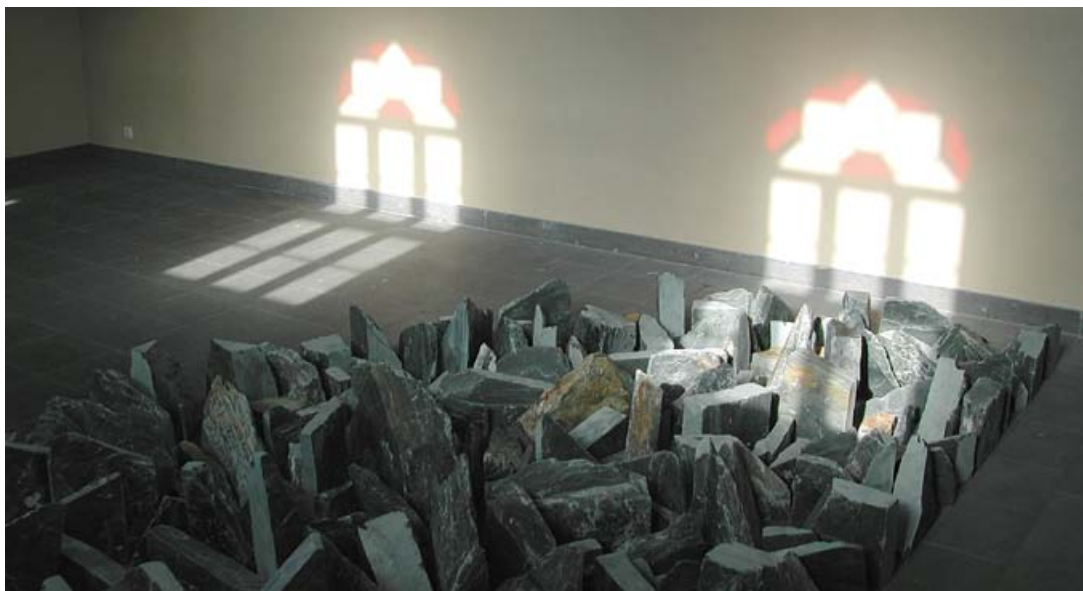
1991 ist das Kunstprojekt Synagoge Stommeln initiiert worden

der 5. Jahreszeit: All dies sind gute Beispiele für den Gemeinschaftssinn der hier lebenden Menschen. Für die Fortbildung bietet die Volkshochschule viele Spezialkurse an. Lehrgänge für die berufliche Weiterbildung, Sprachkurse sowie Angebote für Hobby und Freizeit sind im Programm.