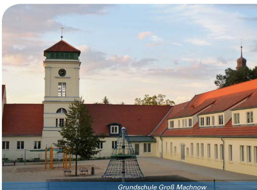
Grundschule Groß Machnow

Seeoberschule Rangsdorf 15834 Rangsdorf Stauffenbergallee 6 Tel.: 033708 44947 E-Mail: info@seeschule.de