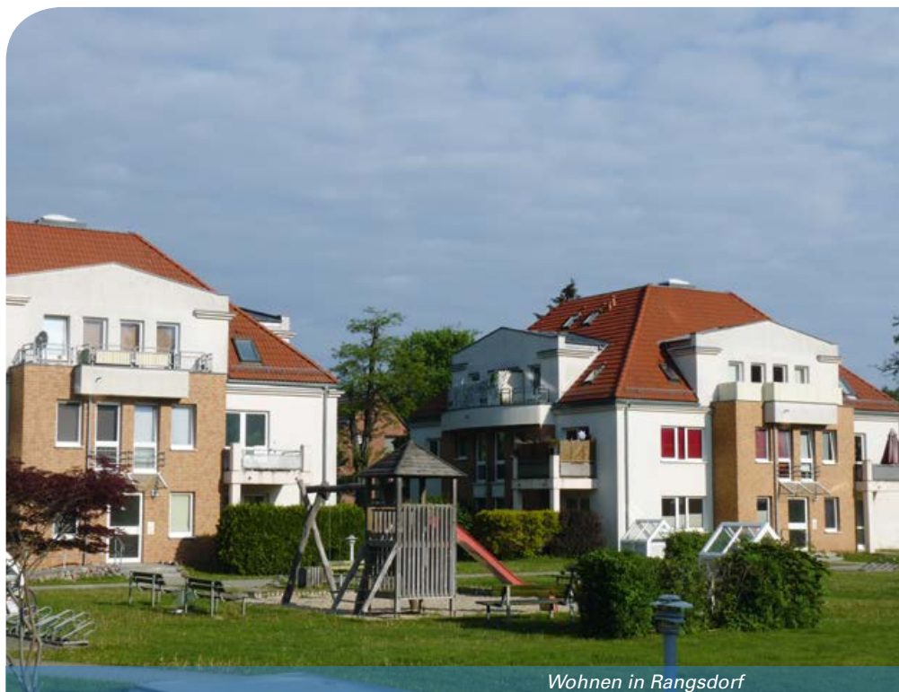
Wohnen in Rangsdorf

Wichtige regionsbezogene Gewerbeareale sind beispielsweise das Gewerbegebiet am Spitzfeld oder das Logistikzentrum in Großbeeren. Ein größeres Industriegebiet befindet sich im Bereich des Theresenhofes. Zahlreiche kleinere Gewerbebetriebe bereichern den Ortskern. Da Rangsdorf insbesondere aufgrund seiner