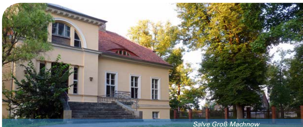
Salve Groß Machnow