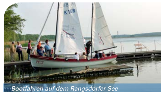
Bootfahren auf dem Rangsdorfer See

Seebadallee 30 15834 Rangsdorf Tel.: 033708 23668 Fax: 033708 23667 E-Mail: tourismus@rangsdorf.de www.tourismus-rangsdorf.de