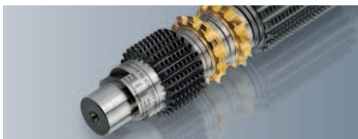
THE PERFORMANCE TEAM