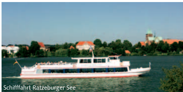
Schiffahrt Ratzeburger See

Das Ufer des Elbe-Lübeck-Kanals lädt zum Radfahren ein, aber auch der Elbe-Radweg von Bad Schandau bis Cuxhaven erfreut sich großer Beliebtheit. Die schöne Landschaft und die reizvollen Orte haben aus dem Kreis Herzogtum Lauenburg ein bekanntes touristisches Ziel gemacht.