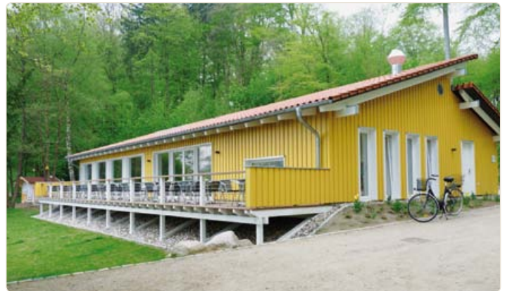
Fährhaus „Hollersche Anlagen“

Die Nutzung des Fährhauses wird durch die Entrichtung einer zusätzlichen Gebühr zu den Standesamtsgebühren in Höhe von 100,- Euro ermöglicht.