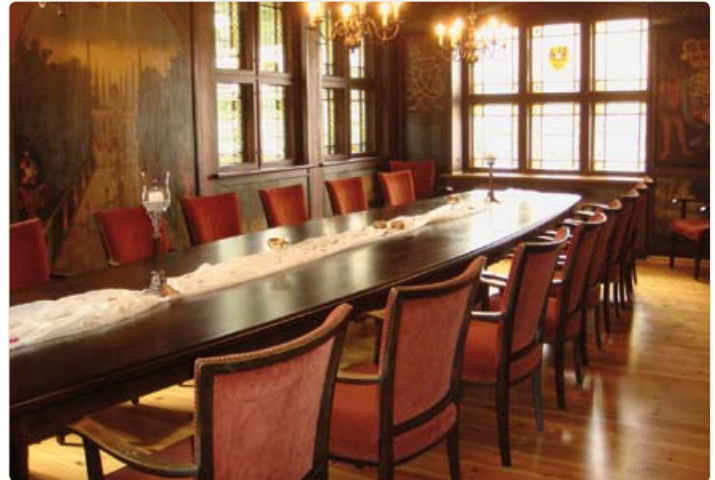
Senatszimmer im Alten Rathaus