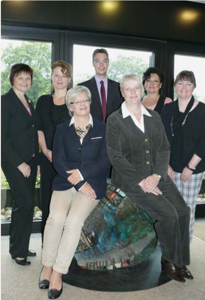
Das Team der Verwaltungsgemeinschaft