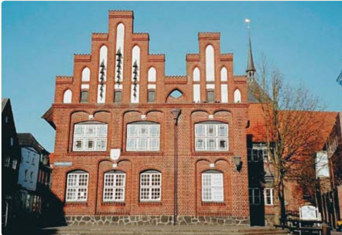
Außenansicht vom Alten Rathaus

Das Alte Rathaus wird inzwischen für die Arbeit der städtischen Gremien, der Ratsversammlung sowie der Ausschüsse, für repräsentative Zwecke der Stadt Rendsburg sowie für Trauungen genutzt.