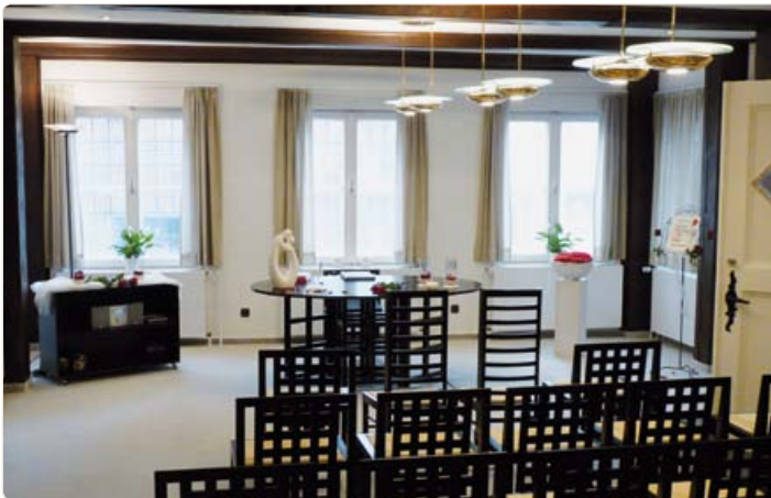
Modernes Trauzimmer im Erdgeschoss des Alten Rathauses

Tourist-Information Nord-Ostsee-Kanal Schiffbrücken Galerie Schiffbrückenplatz 17, 24768 Rendsburg Telefon: +49 (0)4331 21120 E-Mail: info@tinok.de Internet: www.tinok.de