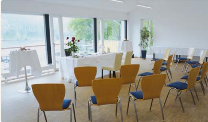
Trauzimmer im Fährhaus „Hollersche Anlagen“