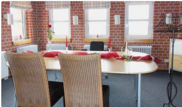
Turmzimmer im Jugendfeuerwehrzentrum

Von Mai bis Oktober sind Eheschließungen auch an den zweiten Samstagen des jeweiligen Monats in der Zeit von 11.00 – 14.00 Uhr möglich.