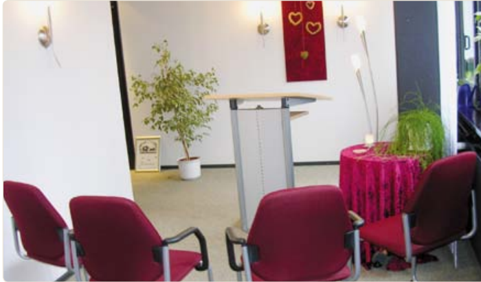
Trauzimmer im Neuen Rathaus

Ihr Wunsch ist es, in einem kleineren Rahmen zu heiraten? Vielleicht nur Sie beide als Paar oder nur mit Trauzeugen. Wir können auch diese Wünsche erfüllen: Im Neuen Rathaus von Rendsburg steht unser kleines, aber feines Trauzimmer, in dem neben dem Brautpaar maximal acht Gäste Platz finden, hierfür zur Verfügung, übrigens ebenfalls ohne Zahlung einer zusätzlichen Gebühr.