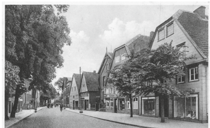
RHEDA (Bez. Minden). Langestraße

„Lernen im Lebenslauf“, ist die Maxime, nach der die VHS ihr reichhaltiges Bildungs- und Kulturangebot um den Menschen in der Region die Möglichkeit für lebenslange Lernprozesse mit Rücksicht auf die individuelle Biografie bereitzustellen. Zu den Kunden zählen auch Unternehmen und externe Auftraggeber, wie beispielsweise die „Agentur für Arbeit“ sowie das „JobCenter“.