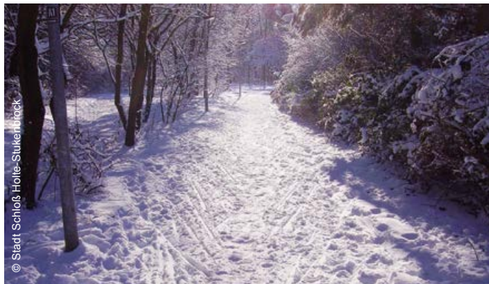
Winter im Sportpark