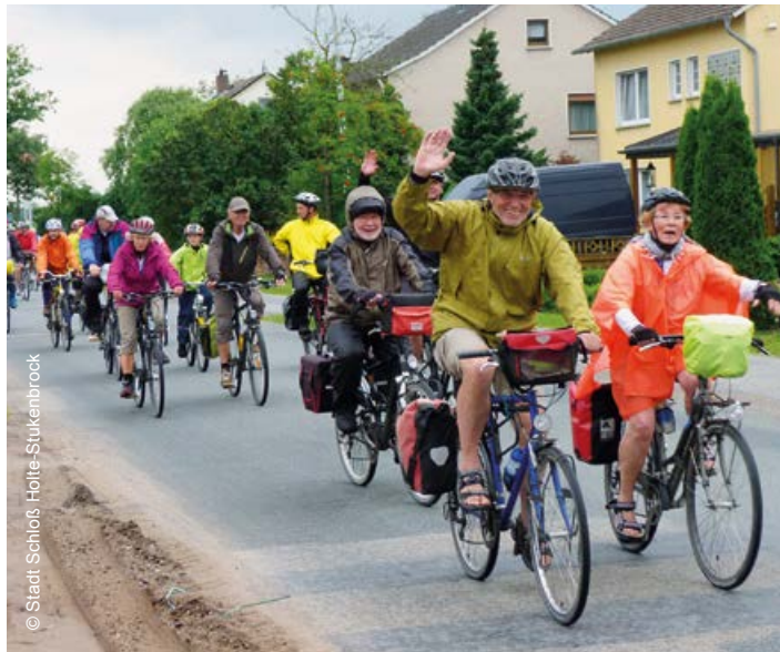
NRW-Radtour 2012