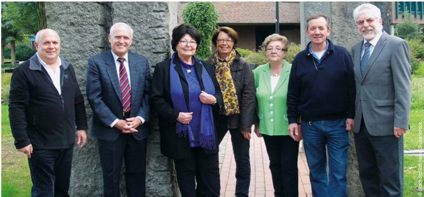
Der Seniorenbeirat (2011-2015)

Wer Anteil nimmt am Leben, wer Kontakte und Freundschaften pflegt und auch die schönen Dinge und Erfahrungen zu genießen versteht, der bleibt innerlich jung und ist weniger anfällig für Altersbeschwerden und Krankheiten.