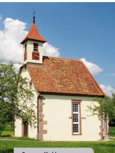
Beurener Kirche