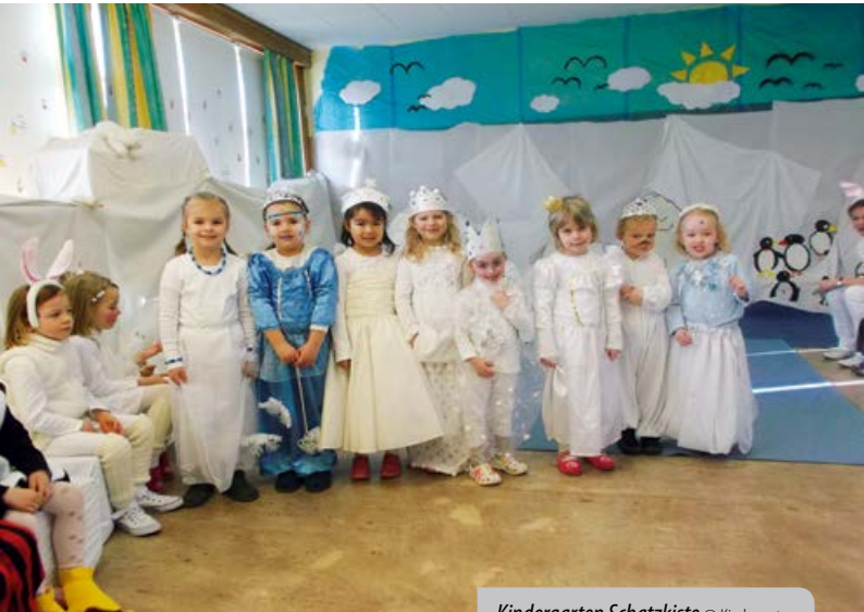
Kindergarten Schatzkiste