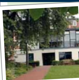
Das Haus für Pflege und Betreuung.