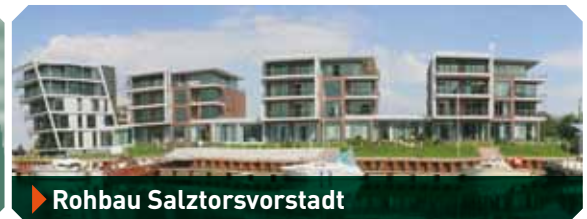
▶ Rohbau Saltorsvorstadt