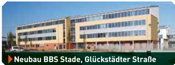
▶ Neubau BBS Stade, Glückstädter Straße

Weitere Referenzen und Informationen unter: lindemann-gruppe.de | J. Lindemann GmbH & Co. KG | Stade & Hamburg | Tel. 04141 526-0 | info@lindemann-gruppe.de