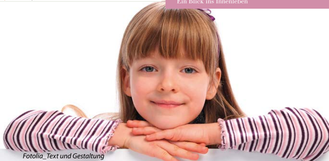
Fotolia_Text und Gestaltung