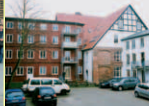
Haus „La vida“