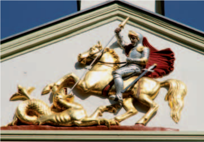
Kloster St. Jürgen am Strande