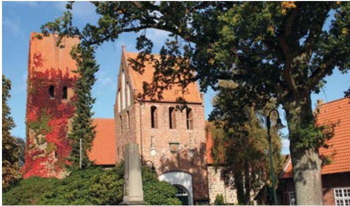
Ev.-luth. Kirche Wiefelstede