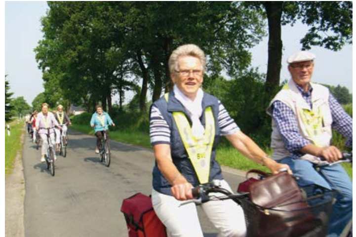
Fahrradgruppe des Seniorenbeirats „Flotte Pedale“

Am Breeden 4 26215 Wiefelstede Telefon: 04402 60660 Bürozeiten: Dienstag 8:30 – 11.30 und 16:00 – 19:00 Uhr