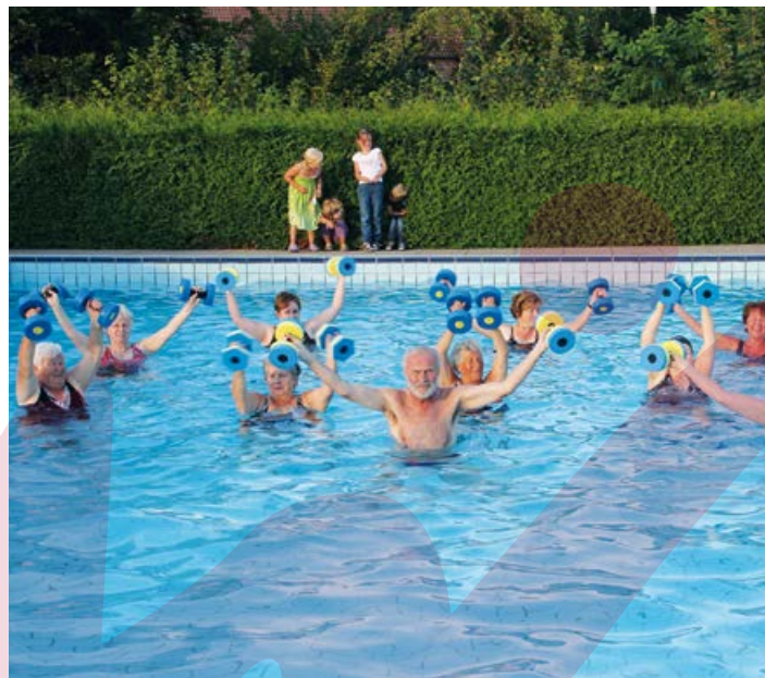
Wassergymnastik Freibad Neuenkrüge