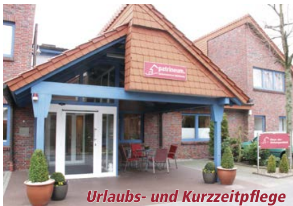
Urlaubs- und Kurzzeitpflege