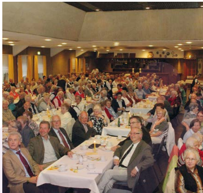
Bunter Nachmittag in Spohle