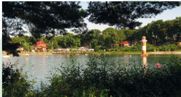
Badesee in Conneforde

Die Pflegekassen sollen Schulungskurse unentgeltlich anbieten, um ein soziales Engagement zu fördern und die Pflege zu erleichtern.