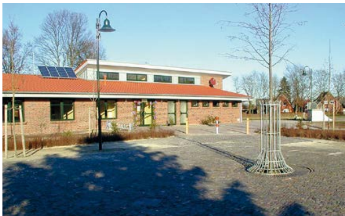
Casa in Metjendorf