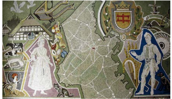
Mosaik der Gemeinde Wiefelstede