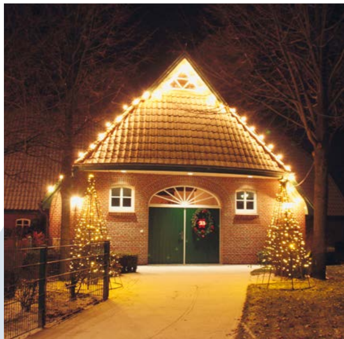
Adventszeit im Hof Kleiberg

Die Belegung erfolgt durch die Ammerländer Wohnungsbaugesellschaft mbH (AWG) Bahnhofstr. 7 26655 Westerstede Telefon: 04488 84640 E-Mail: info@ammerlaender-wohnungsbau.de Internet: www.ammerlaender-wohnungsbau.de