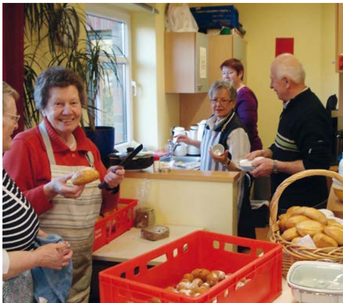
Vorbereitung des Frühstücks im CASA

Und fast genau so wichtig: Sagen Sie einer Person Ihres Vertrauens unbedingt, wo sich für den Fall des Falles die Dokumentenmappe befindet!