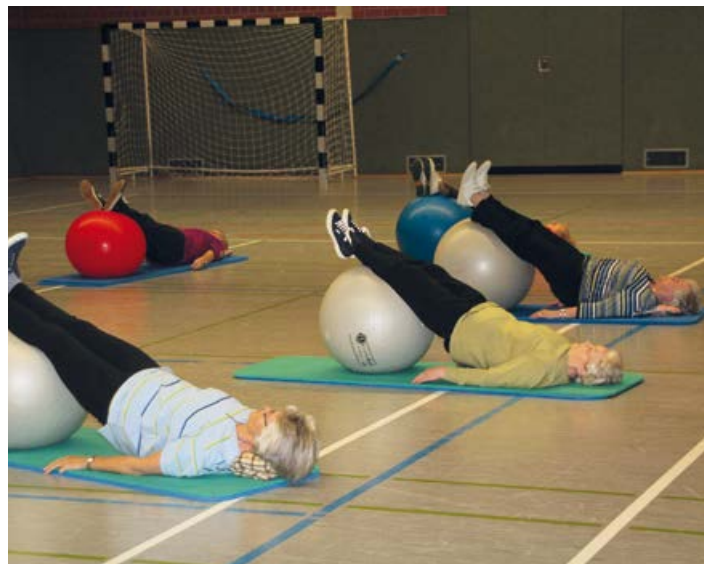
Frauenturnen in Gristede