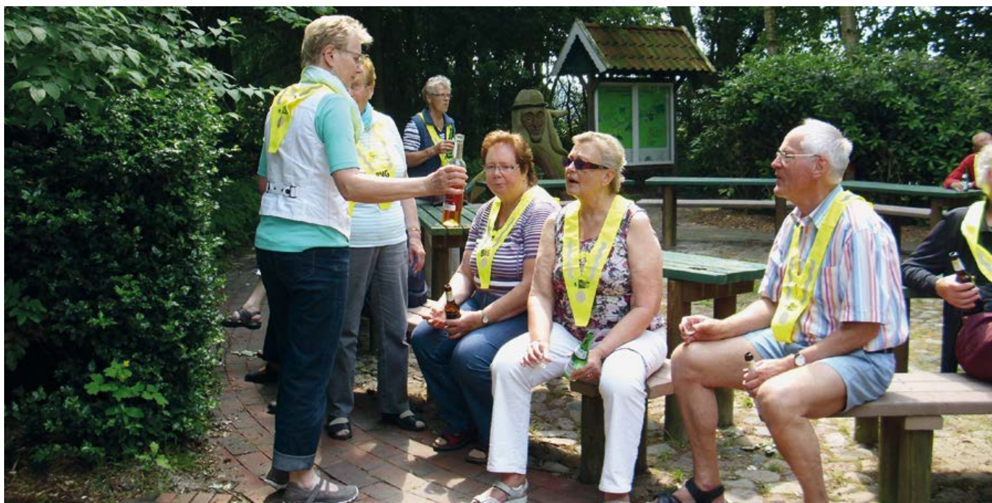
Kurze Pause der Fahrradgruppe „Flotte Pedale“

Viele Kirchen – und Pfarrgemeinschaften sowie Verbände, wie z. B. Diakonie, Arbeiterwohlfahrt, Malteser etc. sind Ansprechpartner für Besuchs- und Fahrdienste (für behinderte Menschen, vor allem für Rollstuhlfahrer und schwer Gehbehinderte). Fragen Sie vor Ort danach.