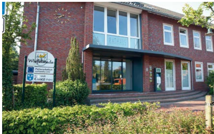
Rathaus in Wiefelstede