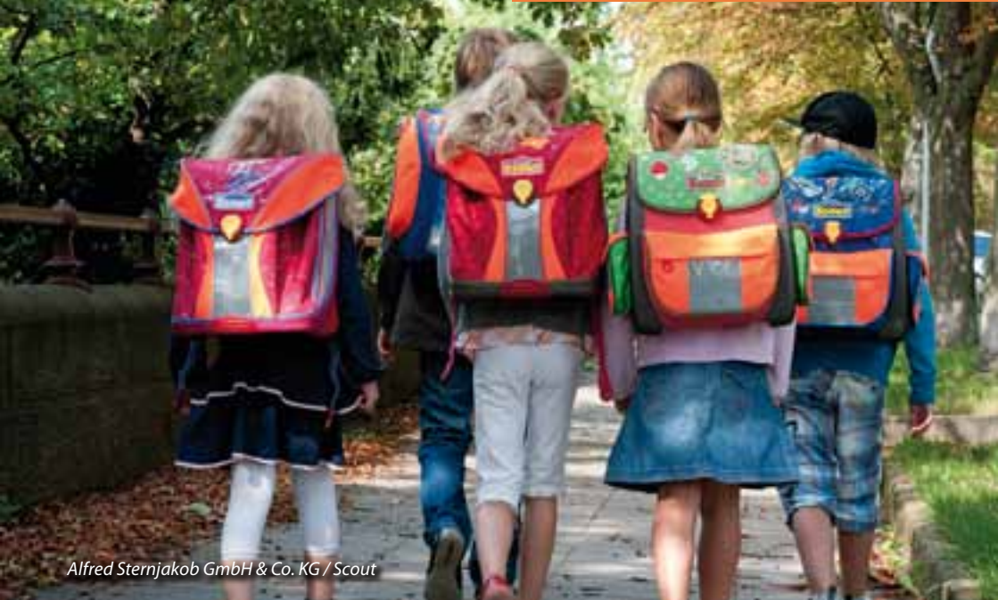
Alfred Sternjakob GmbH & Co. KG / Scout