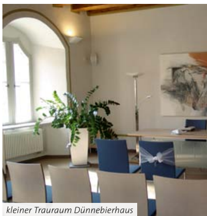
kleiner Trauraum Dünnebieerhaus