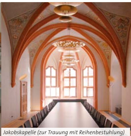
Jakobskapelle (zur Trauung mit Reihenbestuhlung)