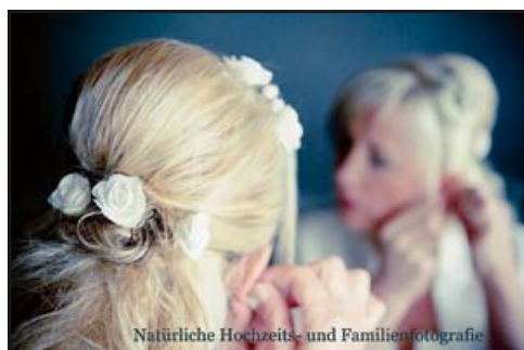
Natürliche Hochzeits- und Familienfotografie