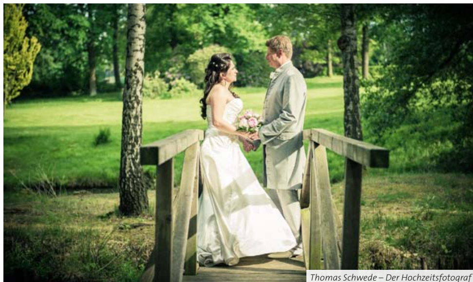
Thomas Schwede – Der Hochzeitsfotograf

Ob Aufnahmen im Studio, im Freilichtstudio oder an einem besonders schönen Ort, es entstehen Bilder von einmaliger Harmonie und perfekter Gestaltung. Nach Absprache begleitet Sie Ihr Fotograf von der standesamtlichen und kirchlichen Trauung bis zum Ende der Feier. Den Fotografen sollten Sie jedoch rechtzeitig bestellen und nicht bis zum letzten Moment warten.