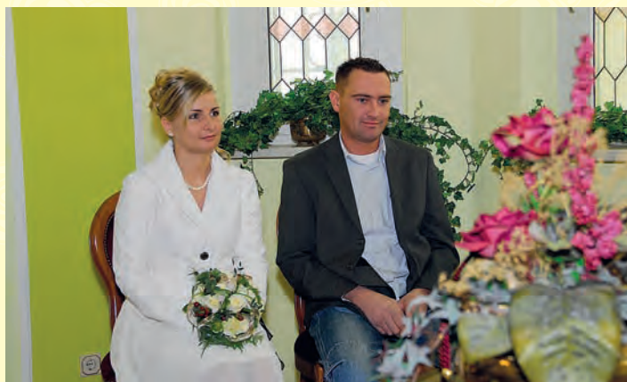
Der schönste Tag...

Eine generelle Pflicht zur Beurkundung einer im Ausland erfolgten Geburt besteht nicht. Auch eine ordnungsgemäße ausländische Geburtsurkunde beweist die Tatsache der Geburt.