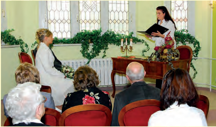
Trauung im Trauzimmer des Barockgartens.