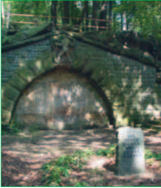
■ Ehrenmal zur Erinnerung an die Gefallenen zweier Weltkriege