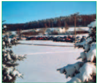
■ Der im Ortsteil Gickelsberg befindliche Skilift befördert die Wintersportler auf den Schleißberg.