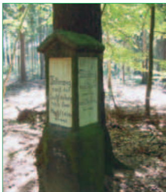
■ Wandersäule im Waldgebiet Luchsenburg