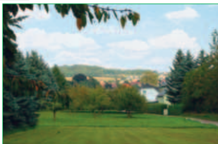
■ Hufewinkel - Blick zum Schleißberg