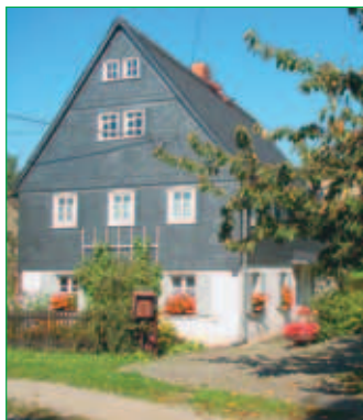
■ Am Dorfteich