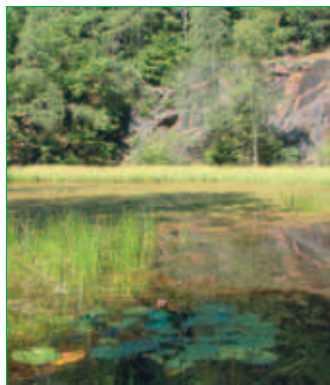
■ „Schneiders Steinloch“ am Hirschberg