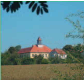
■ Kirchlehn - eine ehemalige Dampfmühle