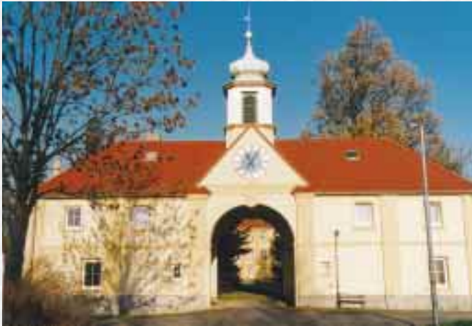
Schloss Lipsa (Torhaus – Eingang zum Schloss)

Als Naturschutzobjekte werden demnächst ausgewiesen: