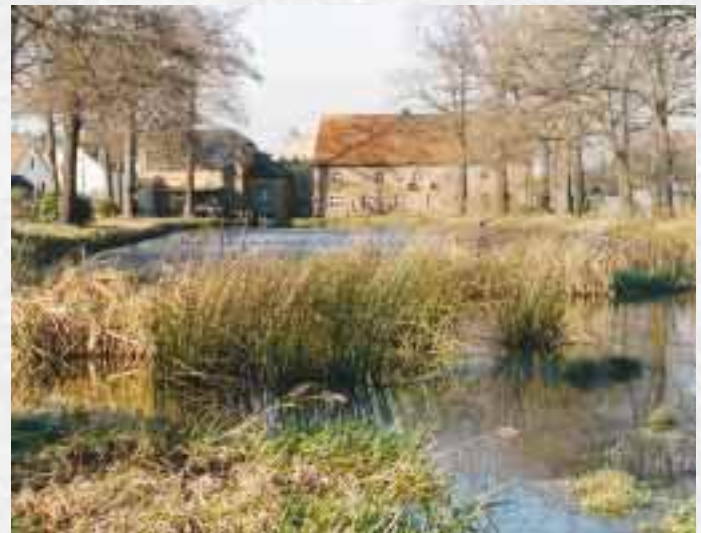
Dorfteich Hermsdorf mit Blick auf Dorfgasthof und Landbäckerei sowie ehemalige Mühle

Beide Dörfer befinden sich mit ihrer Umgebung im Landschaftsschutzgebiet und sind von Wald, Wiesen- und Ackerflächen sowie vielen Wasserflächen und -läufen umgeben.