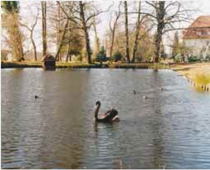
Dorfteich Lipsa, im Hintergrund ein Teil des Schlosses, genutzt als Altenpflegeheim