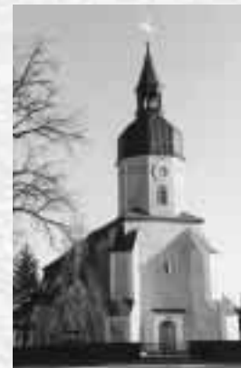
Kirche am Dorfanger

lichen Aussichtsturm auf dem Prossenberg mit Blick auf die umliegenden Regionen und die sich darunter befindenden Sandsteinfelswände, auch „Buck'sche Schweiz“ genannt. Das ehemalige Rittergut, dessen Besitz sich von 1659 bis 1945 immer vom Vater auf den Sohn der Familien von Götz vererbt hat, mit dem Ende des 19. Jahrhunderts erbauten Schloss und dem herrlichen Park mit den alten Bäumen, die Pferdepension Kastanienhof, der neu gestaltete Dorfanger, die restaurierte Kirche am Dorfanger und der großzügig gestaltete Sportplatz, um nur einiges zu nennen.