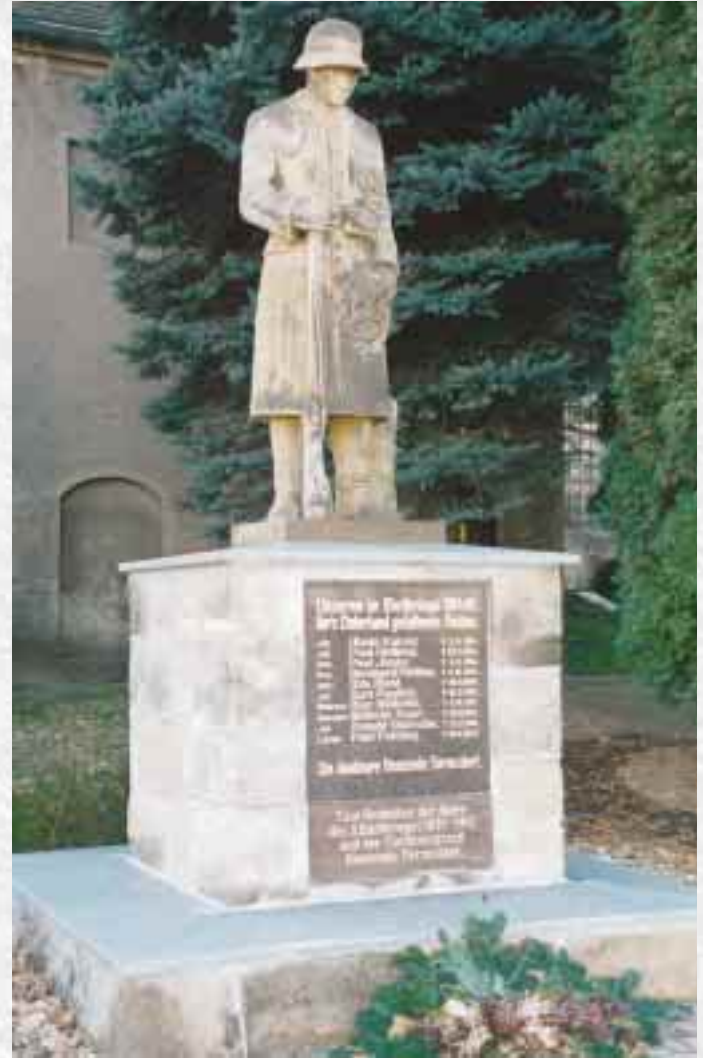
Das Kriegerdenkmal auf dem Friedhof Hermsdorf ist als sehenswert einzustufen.