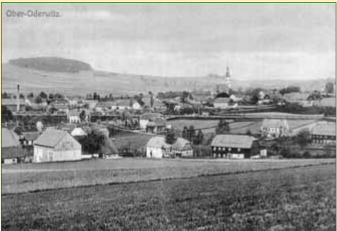
Historische Aufnahme von Oderwitz

Heute sind Betriebe wie die Kathleen-Schokoladenfabrik, das Kabelwerk sowie mittlere und kleinere Handwerksbetriebe die Hauptarbeitgeber.