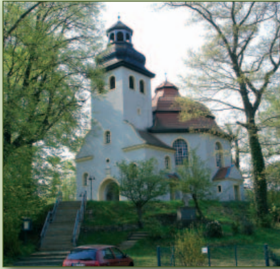
Kirche in Podrosche

Podrosche eine wichtige Bedeutung zu, entstand doch hier eine große Grenzkirche. Im Jahre 1908 entstand anstelle der alten Fachwerkkirche, die 1907 durch einen Blitzschlag abbrannte, eine sehenswerte Rundkirche. Seit 1995 verbindet Podrosche und Przewóz eine Grenzbrücke über die Neiße.