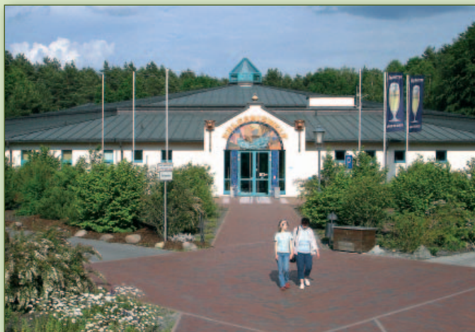
Eingang zur Krauschwitzer Erlebniswelt

Nicht weit vom Oder-Neiße-Radweg wartet eine Ferienwelt auf Ihre Familie. Die Erlebniswelt Krauschwitz mit Erlebnisbad und Saunaparadies bietet vielfältige Möglichkeiten sowohl für sportliche Betätigung und Baderlebnis, als auch für Entspannung und Erholung. Während die Kleinsten im Kinderplanschbecken mit Wasserwerfer, Sprudel und Rutsche ihren Spaß haben, können die Größeren die 45 m Riesenrutsche herunterdüsen oder im Wildwasserkanal gegen