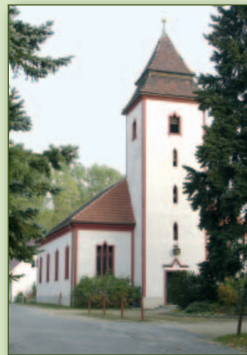
Kirche in Krauschwitz

Der Ortsteil Keula wird 1380 erstmals urkundlich erwähnt. Der Ortsteil Krauschwitz ist als Kruswica erstmals im Jahr 1400 in den Bautzener Ratsakten zu finden. Der Name kommt aus dem Slawischen und bedeutet „Birndorf“. Mit dem Bau der sächsisch-preußischen Staatsstraße im Jahre 1830 von Görlitz nach Cottbus wird die Gemeinde an das überregionale Verkehrsnetz (heutige Bundesstraße 115) angeschlossen.