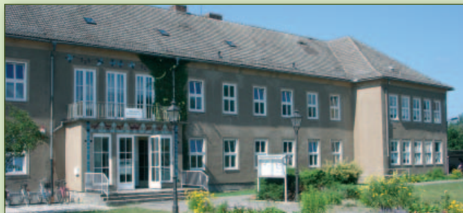
Mittelschule „Geschw. Scholl“