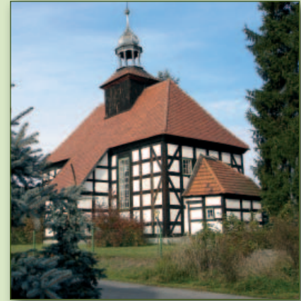
Kirche in Pechern

Wann die hübsche kleine Fachwerkkirche erbaut wurde, ist nicht bekannt. Die ersten Hinweise stammen aus den Jahren 1593 und 1597. Während der Gegenreformation musste das Gotteshaus geschlossen werden. Auf Erlass Friedrich II. bekam im Jahre 1747 die Gemeinde ihre Kirche zurück, die 1751 völlig erneuert eingeweiht wurde. In Pechern befindet sich