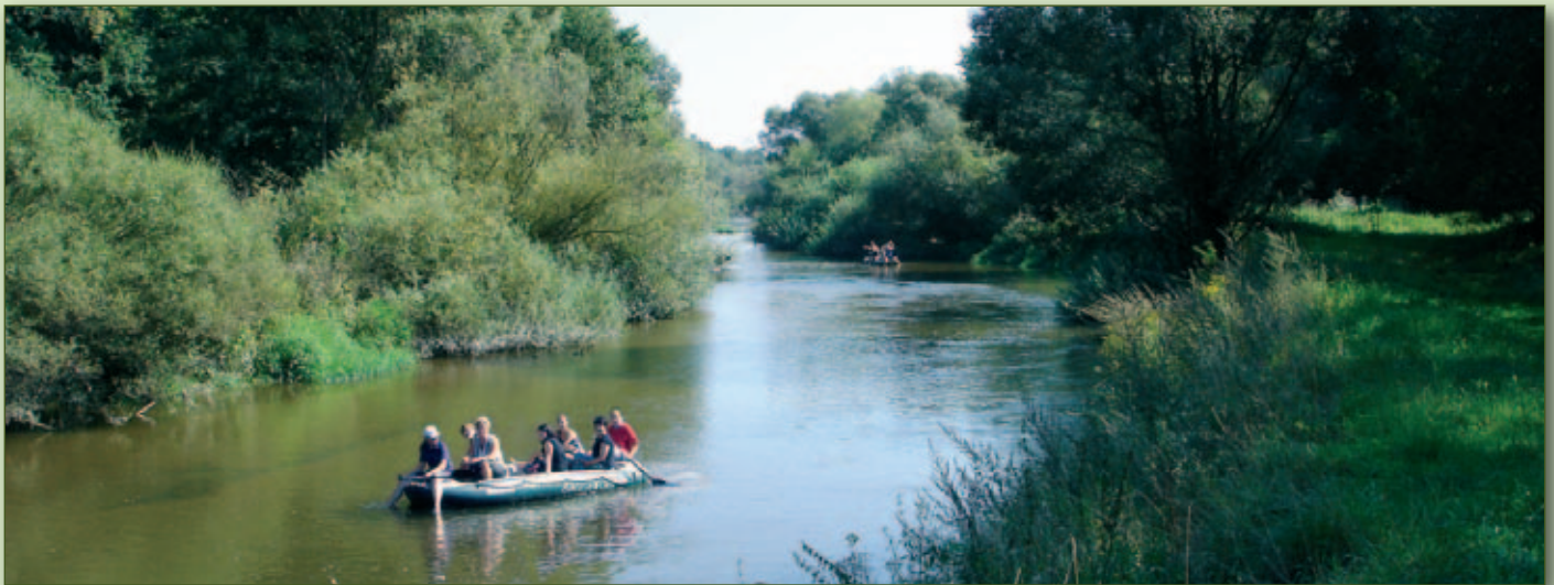
Schlauchbootstour auf der Neiße

Dem Wappen liegen mit Blau und Gelb die Farben der Oberlausitz zugrunde. Darin sind im oberen Teil drei Birnen, die sich auf den sorbischen Namen Krušwica ‚Birndorf‘ beziehen. Amboss und Hammer im unteren Teil symbolisieren die Eisenverhüttung, die den Grundstein für die Gründung Keulas legte.