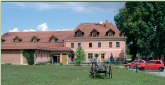
Gasthaus zur Linde